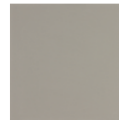
CINZA CLARO CI 29.7x29.7x1.2 cm K3064 | GE17 20x20x1.2 cm K2029 | GE17