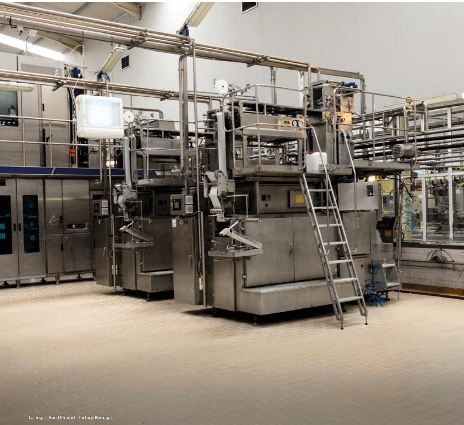
Lactogal - Food Products Factory, Portugal

Solution of maximum robustness and mechanical resistance that offers high resistance to stains and chemical agents, especially suitable for the most demanding spaces in terms of support of heavy loads and of resistance to use in general (for example, parking lots, supermarkets, transport interfaces, industry, laboratories, etc.).