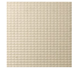
PÉROLA Drainage Textured 29.7x29.7x1.2 cm K3069 | GE22 20x20x1.2 cm K2034 | GE22