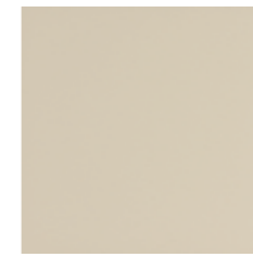
PÉROLA CI 29.7x29.7x1.2 cm K3063 | GE17 20x20x1.2 cm K2028 | GE17