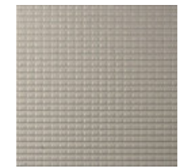
CINZA CLARO Drainage Textured 29.7x29.7x1.2 cm K3070 | GE22 20x20x1.2 cm K2035 | GE22