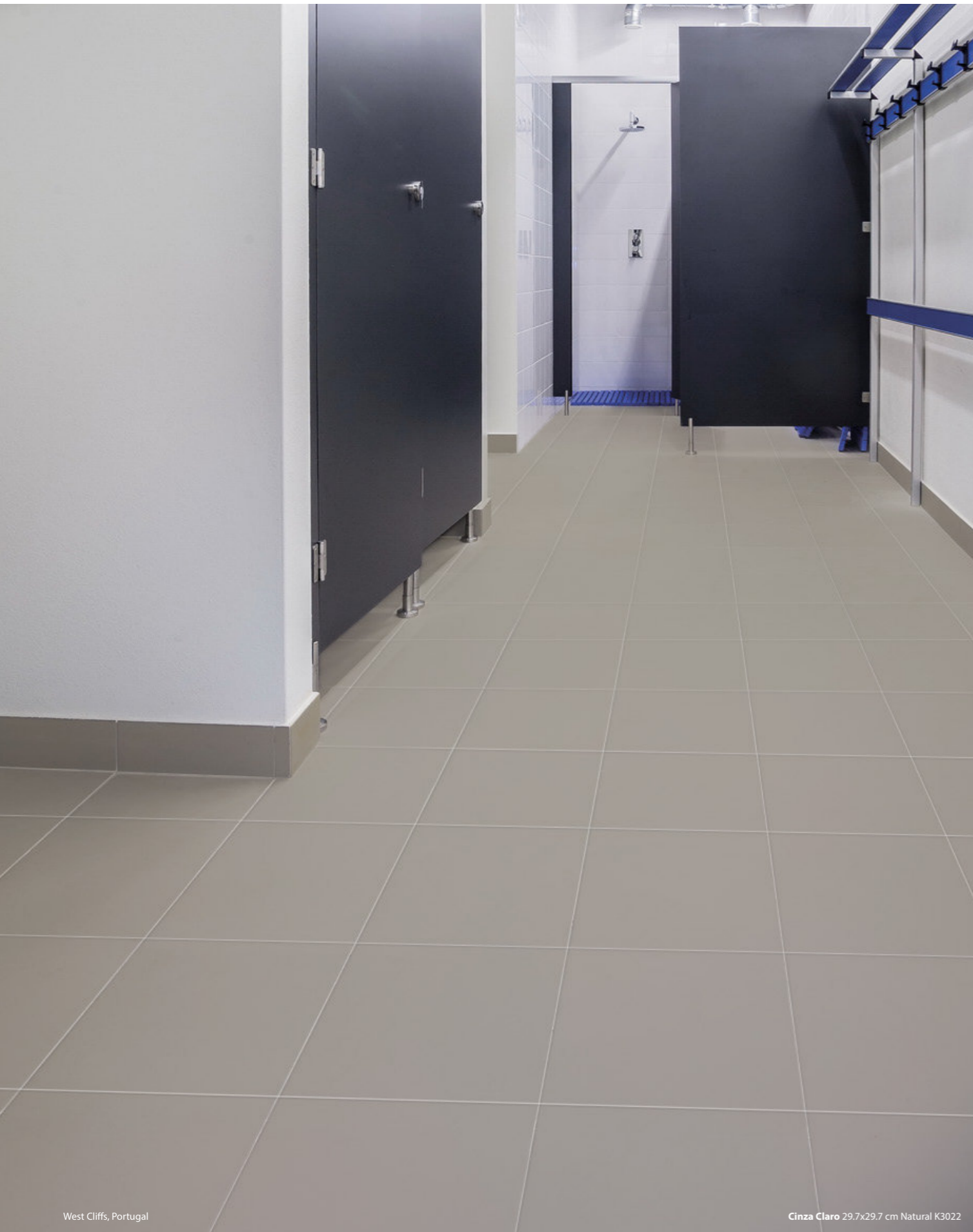
West Cliffs, Portugal