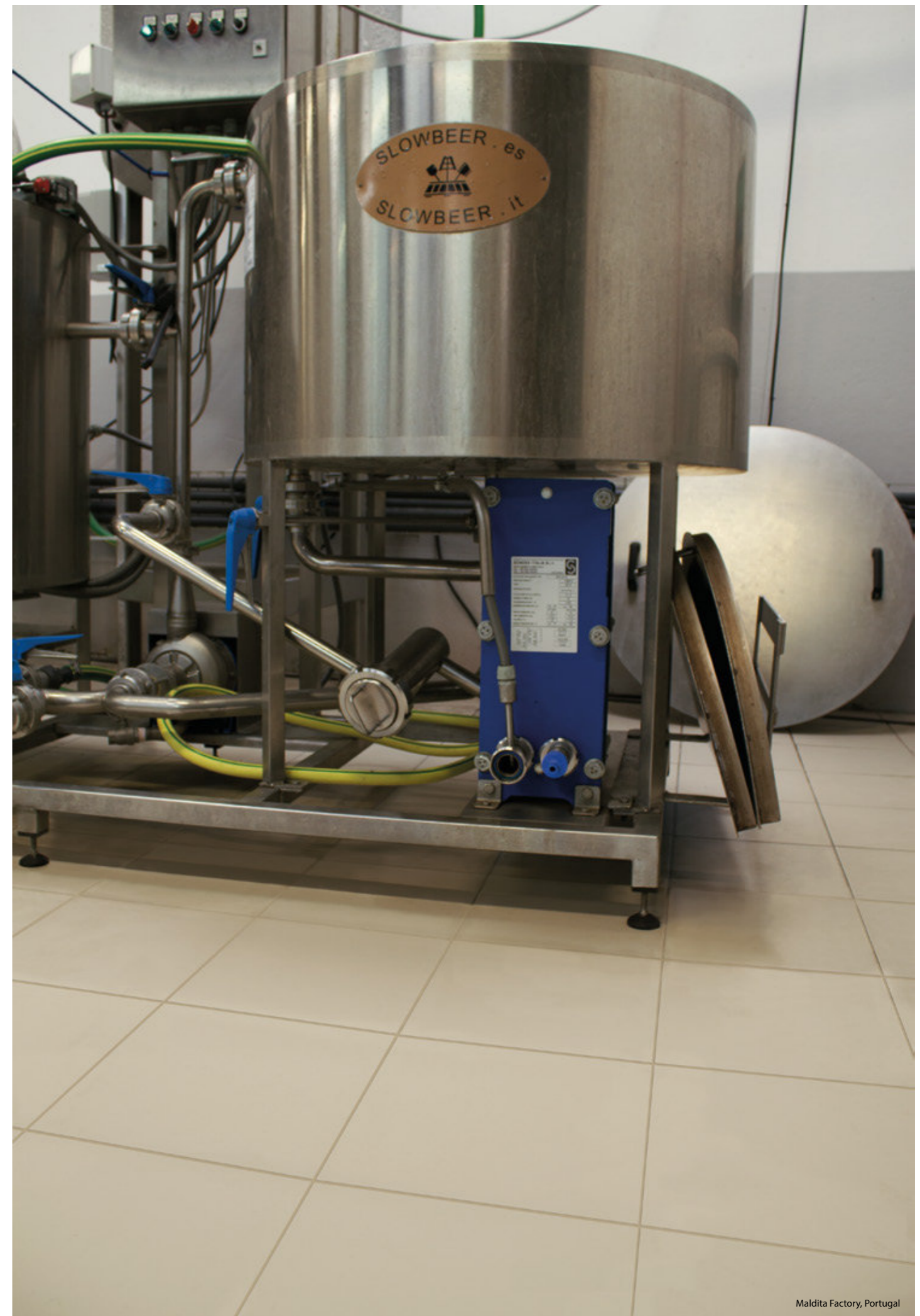
Maldita Factory, Portugal

Dispose de trois formats de base, avec une épaisseur de 1.2cm et 1.4cm, et propose différents types de finition qui répondent à des besoins spécifiques en fonction du type d'utilisation et le niveau de sécurité prévu (naturel, texturé, drainant radial texturé).