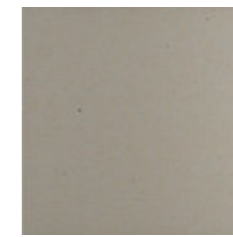
CINZA CLARO Textured CI 29.7x29.7x1.2 cm K3068 | GE17 20x20x1.2 cm K2033 | GE17