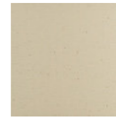
PÉROLA Textured CI 29.7x29.7x1.2 cm K3067 | GE17 20x20x1.2 cm K2032 | GE17