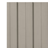
GUIDE LINE CI 20x20 cm LG20 | GE24