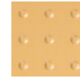
SAFETY LINE CI 20x20 cm LS50 | GE24