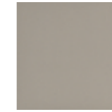
CHANGE OF DIRECTION CI 20x20 cm K2029 (MD20) | GE17