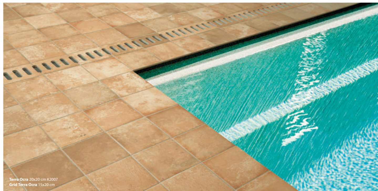
Terra Ocra 20x20 cm K2007 Grid Terra Ocra 15x20 cm

The thickness of the Terra collection will be reduced to 1.2 cm. After the transition period, the price groups will be as indicated below: A espessura da coleção Terra será reduzida para 1.2 cm. Após o período de transição, os grupos de preços serão os indicados abaixo: L'épaisseur de la collection Terra sera réduite à 1.2 cm. Après la période de transition, les groupes de prix seront ceux indiqués ci-dessous: Die Stärke der Terra-Kollektion wird auf 1.2 cm reduziert. Nach der Übergangphase gelten die unten aufgeführten Preisgruppen: El espesor de la colección Terra se reducirá a 1.2 cm. Tras el período de transición, los grupos de precios serán los que se indican a continuación: