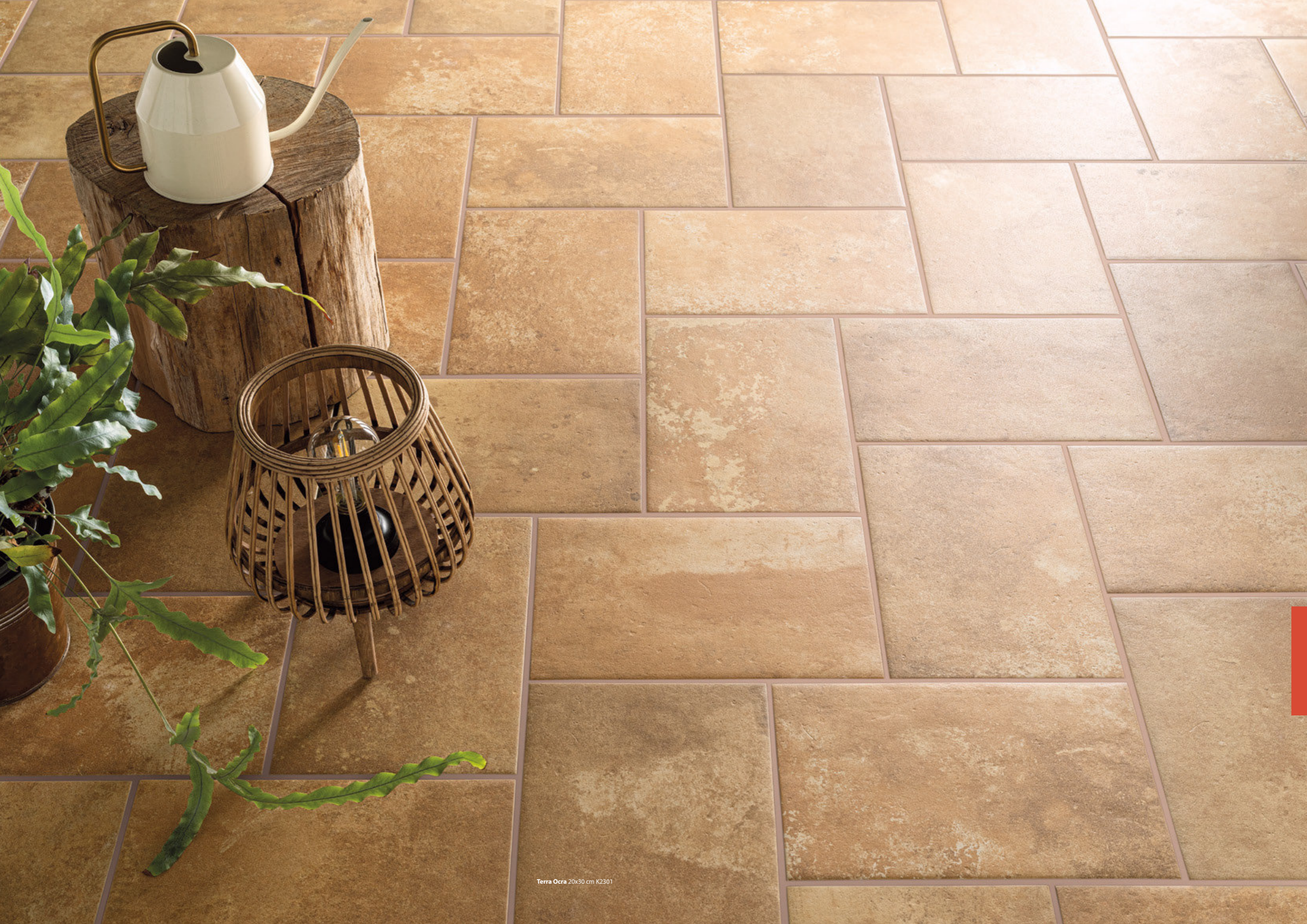
Terra Ocra 20x30 cm K2301