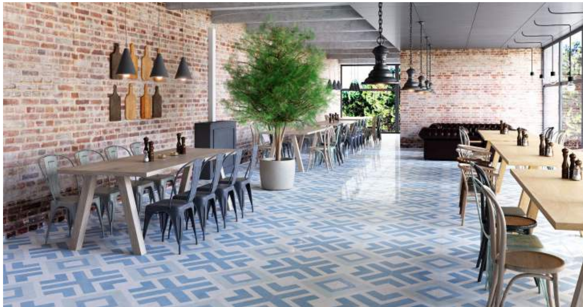
Encaustic cross decor lappato 30x30

Although its composition displays a geometric pattern, it could be some misalignments since this tile is a reproduction of a handmade encaustic. The use of wide joints may aggravate the pattern continuity. Aunque la composición forme un patrón geométrico, las líneas pueden no coincidir perfectamente al ser una reproducción de un producto artesanal. El uso de juntas grandes podría afectar negativamente a la continuidad del dibujo.