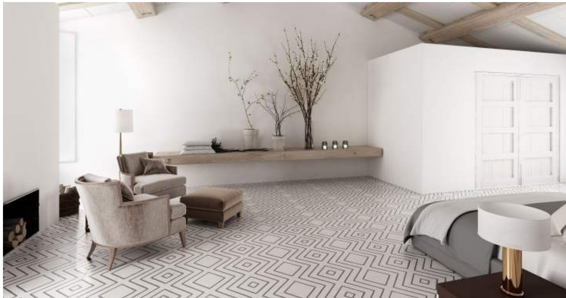
Encaustic white decor lappato 30x30

Although its composition displays a geometric pattern, it could be some misalignments since this tile is a reproduction of a handmade encaustic. The use of wide joints may aggravate the pattern continuity. Aunque la composición forme un patrón geométrico, las líneas pueden no coincidir perfectamente al ser una reproducción de un producto artesanal. El uso de juntas grandes podría afectar negativamente a la continuidad del dibujo.