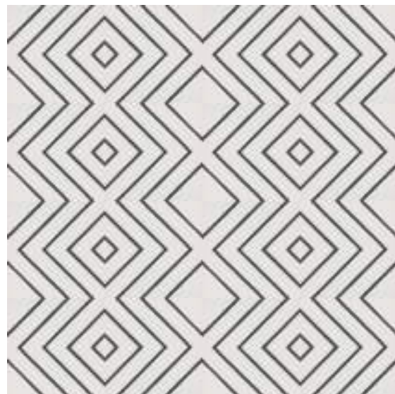
Encaustic 30x30 (29,75 x 29,75 cm - 11.71" x 11.71")