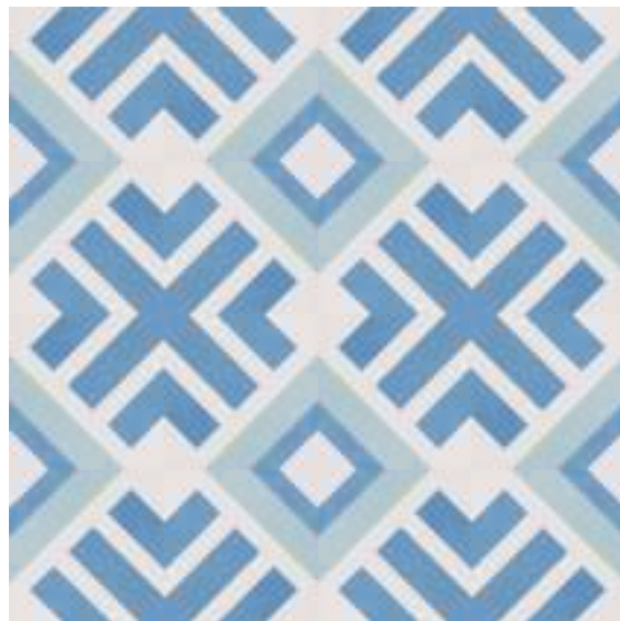
Encaustic 30x30 (29,75 x 29,75 cm - 11.71" x 11.71")