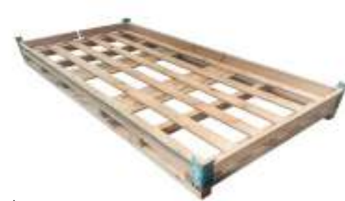
Crate / caja madera