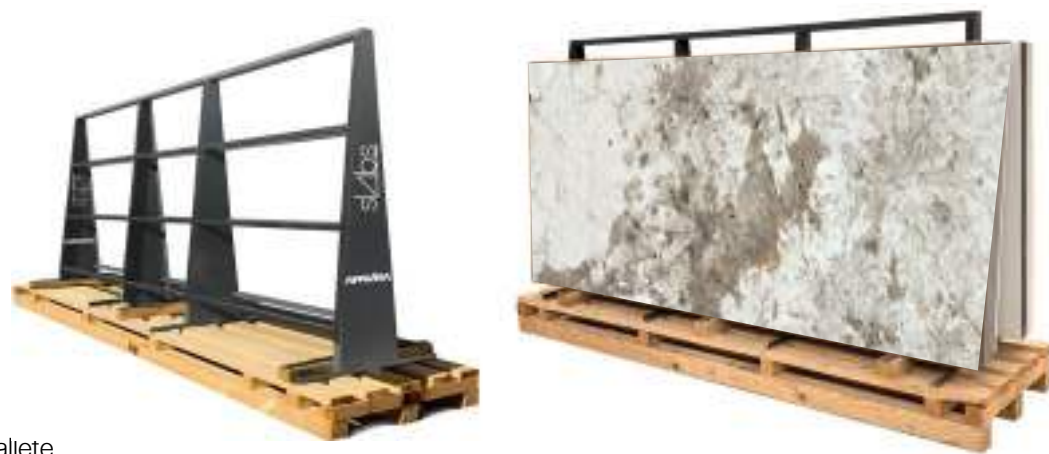
A-frame / Caballete