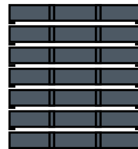
7 levels / 7 niveles