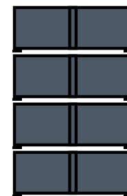
4 levels / 4 niveles