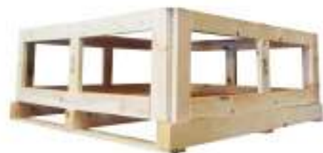
Pallet / palet