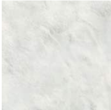
G ALEXANDRIA WHITE POL RECT 120X120 / 48"X48" L97/M