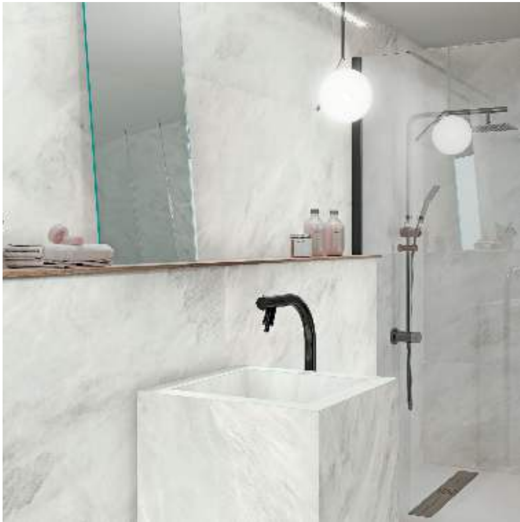
ALEXANDRIA WHITE MATT RECT 60X120