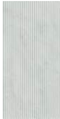
M KLEBB MATT RECT 60X120 / 24"X48" L98/M