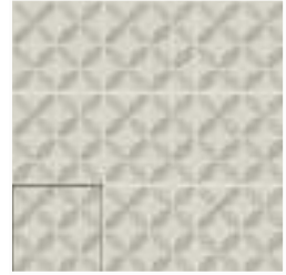
ENYA PUMICE 15X15 / 6"X6"