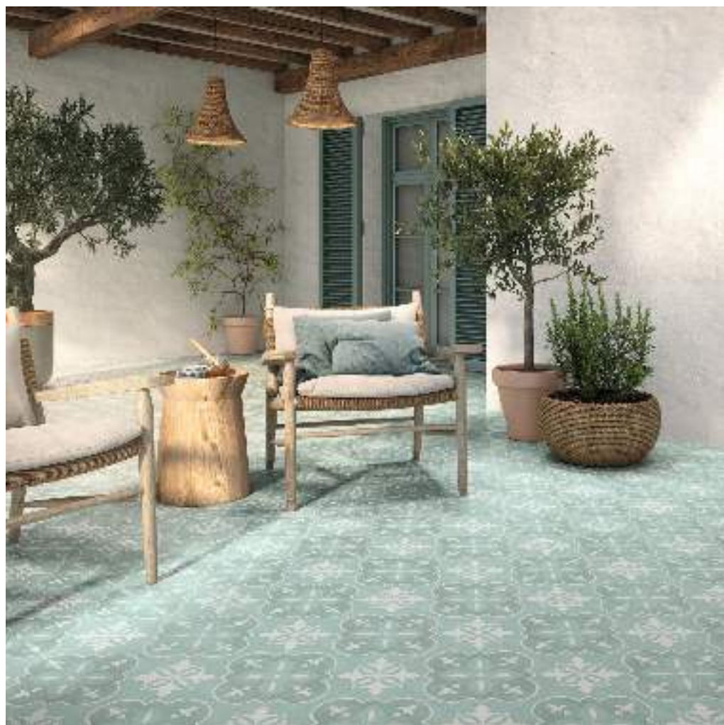
NORA ACQUA 15X15