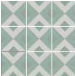
BRIANNA ACQUA 15X15 / 6"X6"