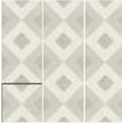
BRIANNA PUMICE 15X15 / 6"X6"