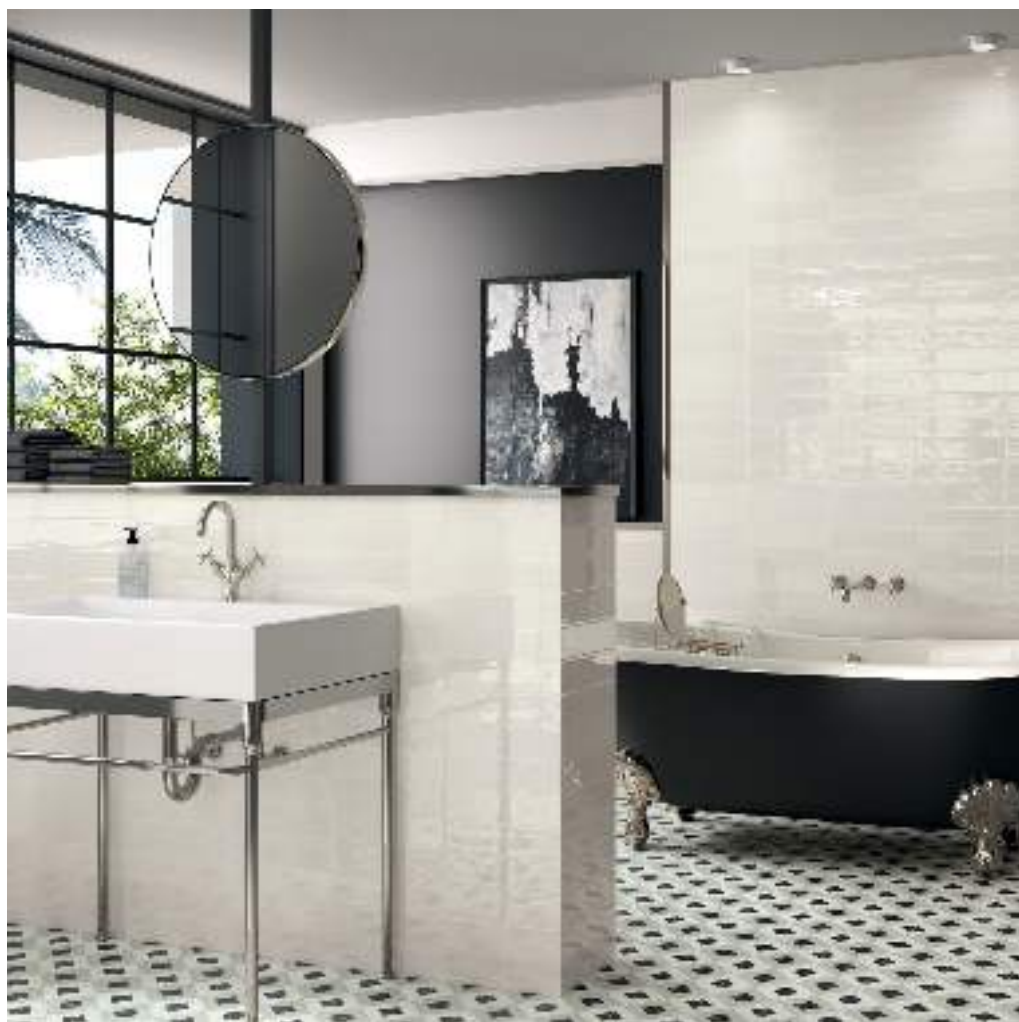
BRIANNA COAL 15X15 / MUD WHITE 7,5X30