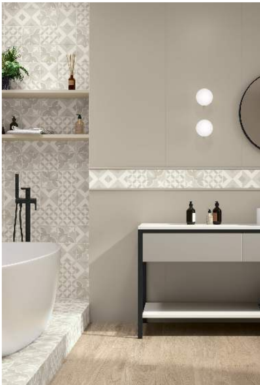
BRIANNA PUMICE 15X15 / NUANCES NATURAL RECT 20X120 / CHAMPAGNE MATT RECT 60X120