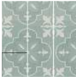
NORA ACQUA 15X15 / 6"X6"