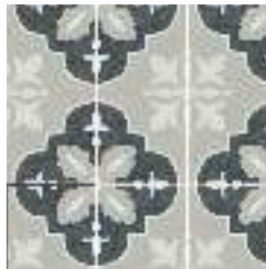
NORA COAL 15X15 / 6"X6"