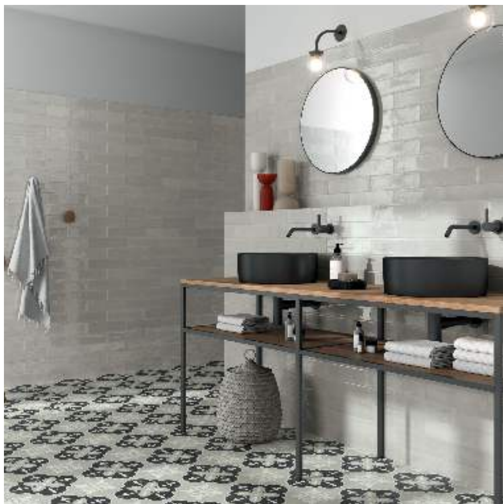
MUD GREY 7,5X30 / NORA COAL 15X15