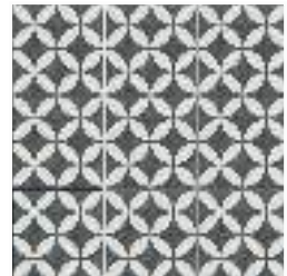
ENYA COAL 15X15 / 6"X6"