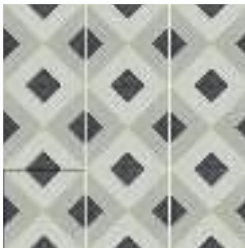
BRIANNA COAL 15X15 / 6"X6"