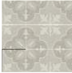
NORA PUMICE 15X15 / 6"X6"