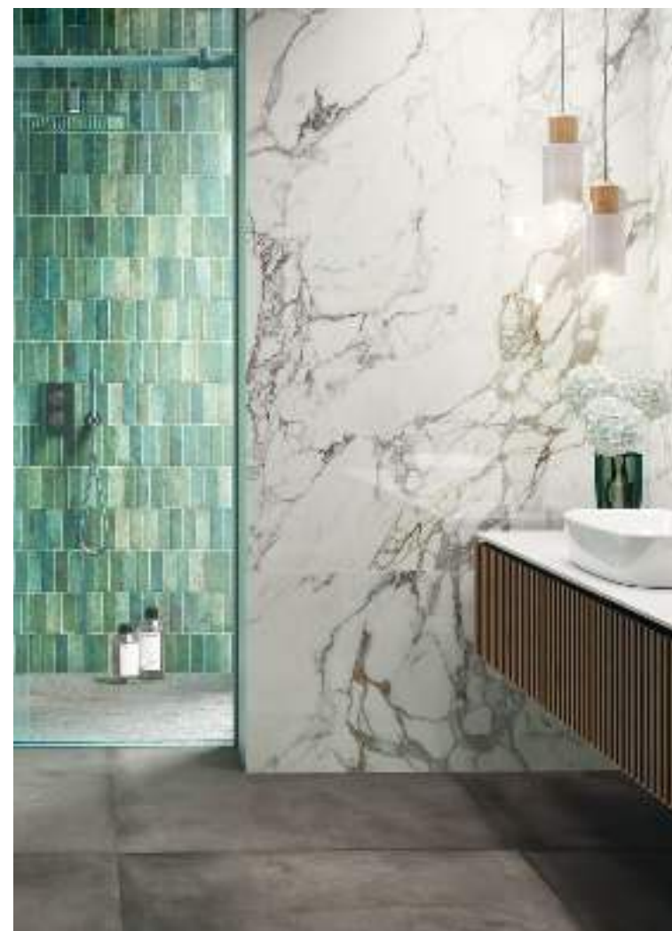
CALACATTA SILVER POL. RECT. 59X119 / CITY MOOD COAL RECT. 100X100 / TENNESSEE GREEN 5,2X16,1