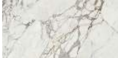
* CALACATTA SILVER POL RECT 59X119 / 24"X48" P50 /M