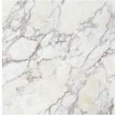
* CALACATTA SILVER POL RECT 119X119 / 48"X48" J41/M