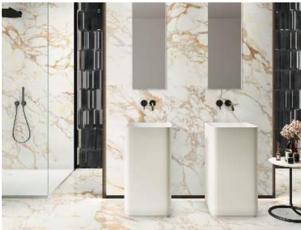
CALACATTA GOLD POL. RECT. 59X119 / REALITY NIGHT 7,5X30