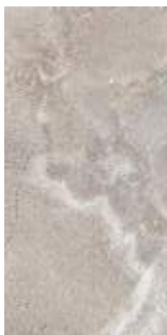
CROSS SAND RECT 60X120 / 24"X48" J65/M

C3 R11 ANTI-SLIP CROSS WHITE RECT 60X120 / 24"X48" J66/M