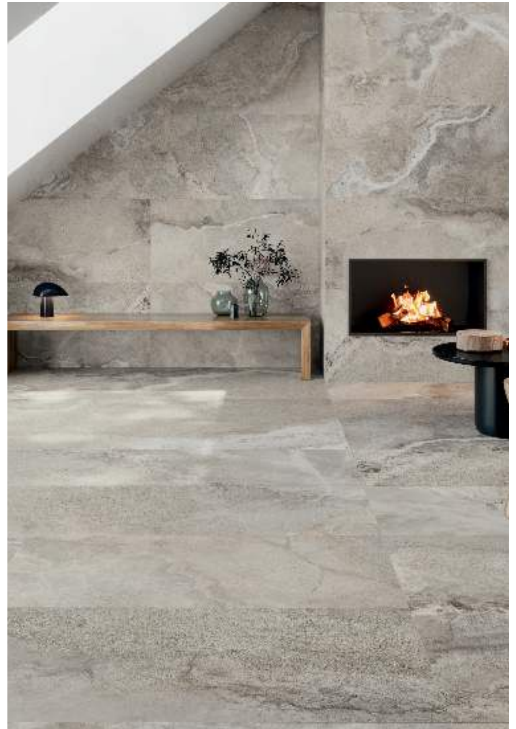
CROSS SAND RECT 60X120