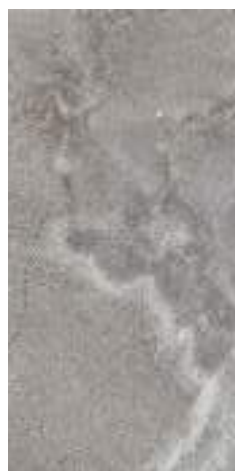
CROSS TAUPE RECT 60X120 / 24"X48" J65/M

C3 R11 ANTI-SLIP CROSS SAND RECT 60X120 / 24"X48" J66/M