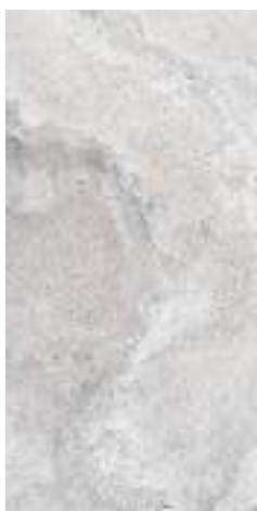
CROSS WHITE RECT 60X120 / 24"X48" J65/M

60X120 - 60X60 - 30X60 - 15X15/24"X48" -24"X24" -12"X24"-6"X6"