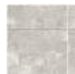
MOSAICO CROSS WHITE 30X30 (5X5) / 12"X12" K01/P