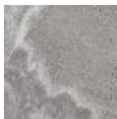
CROSS TAUPE RECT 60X60 / 24"X24" P17/M