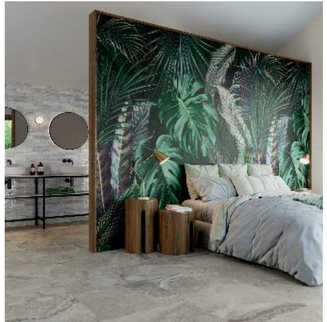
DECOR VISAYA I 120X260 / DECOR VISAYA II 120X260 / PUMICE MATT RECT 60X120 / CROSS TAUPE RECT 60X60