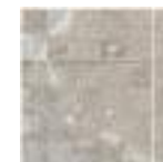
MOSAICO CROSS SAND 30X30 (5X5) / 12"X12" K01/P