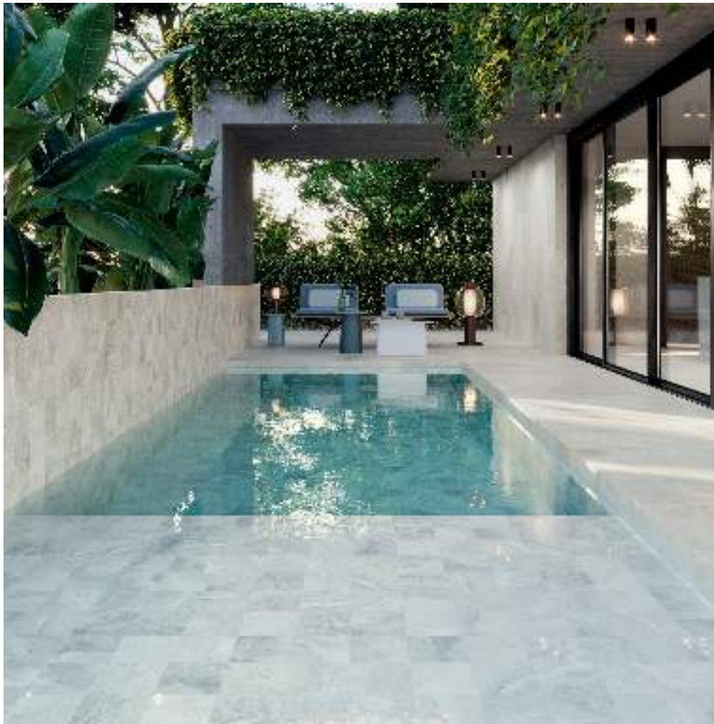
CROSS WHITE 15X15 / ANTI-SLIP ARGILLAE NEVE RECT 60X120