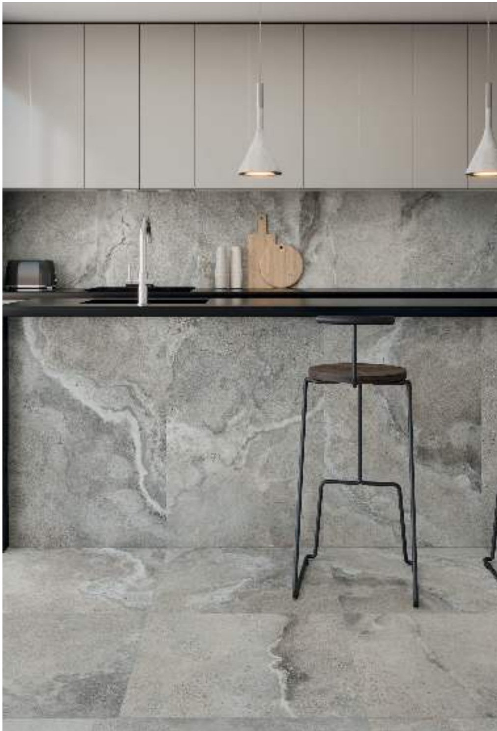
CROSS TAUPE RECT 60X120 / CROSS TAUPE RECT. 60X60