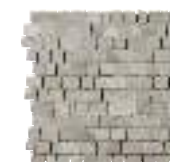
MALLA SPACCO CROSS SAND 30X30/12"X12" K70/P