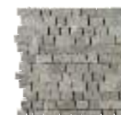
MALLA SPACCO CROSS TAUPE 30X30/12"X12" K70