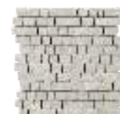
MALLA SPACCO CROSS WHITE 30X30/12"X12" K70/P