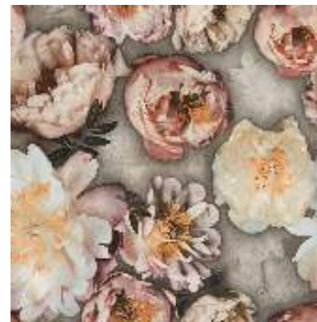
DECOR SET (2) CROSS 60X120 / 24"X48"

C3 R11 ANTI-SLIP CROSS TAUPE RECT 60X120 / 24"X48" J66/M