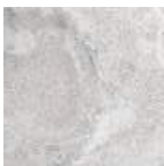
CROSS WHITE RECT 60X60 / 24"X24" P17/M