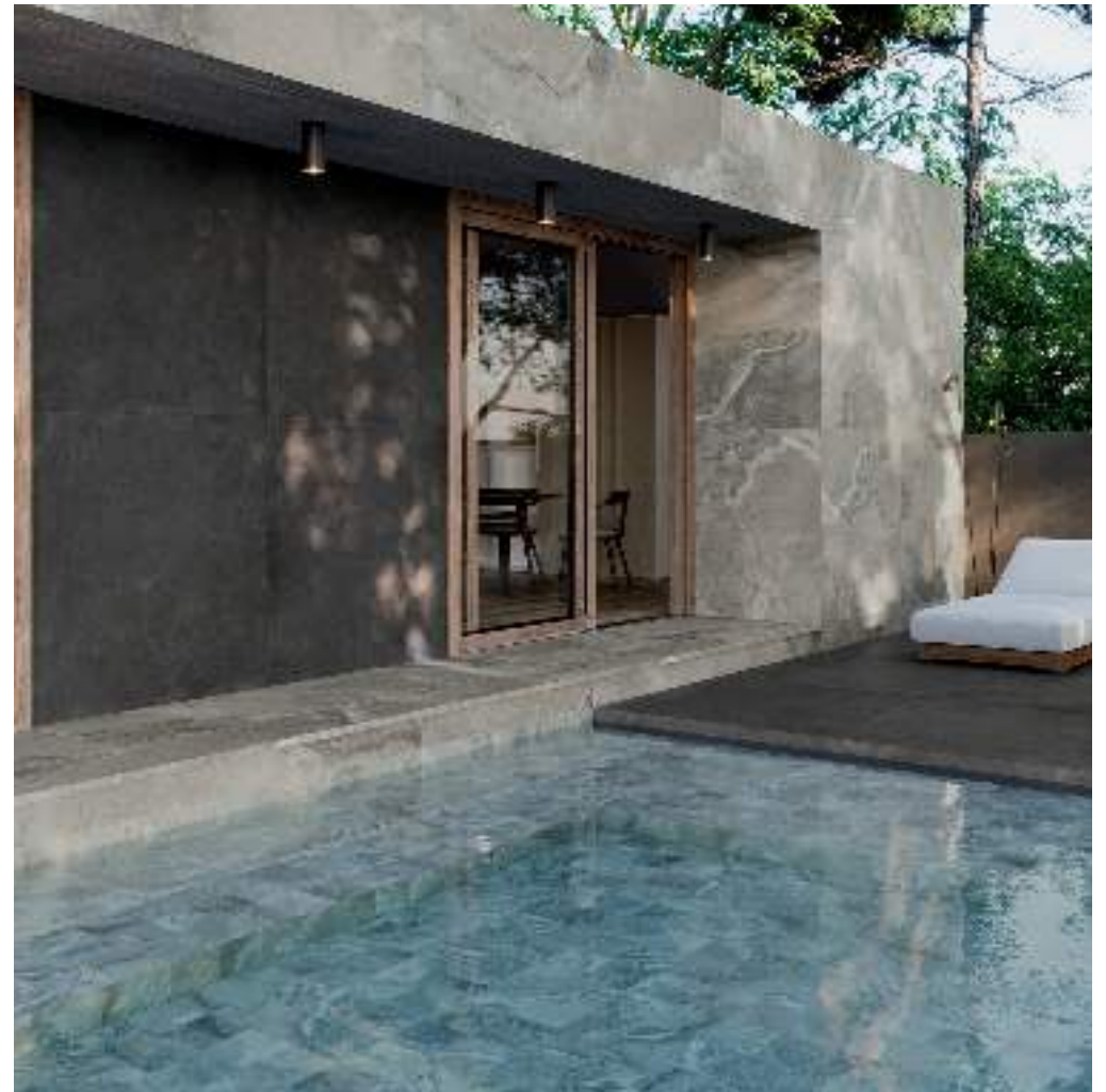
ANTI-SLIP CROSS TAUPE RECT 60X120 / CROSS TAUPE 15X15 / ARGILLAE NOCTA RECT 60X120