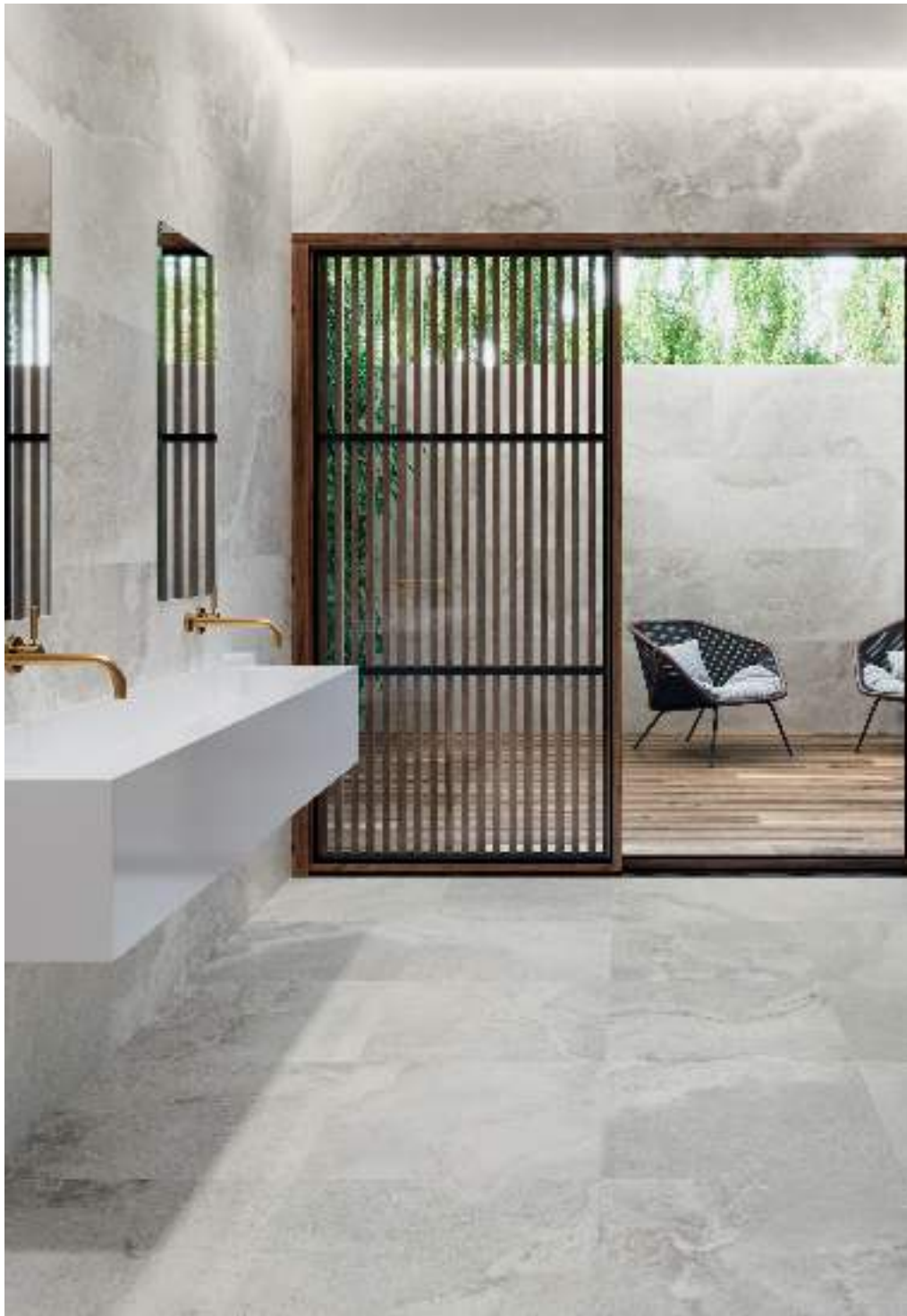
CROSS WHITE RECT 60X120 / CROSS WHITE RECT. 60X60