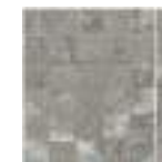
MOSAICO CROSS TAUPE 30X30 (5X5) / 12"X12" K01/P