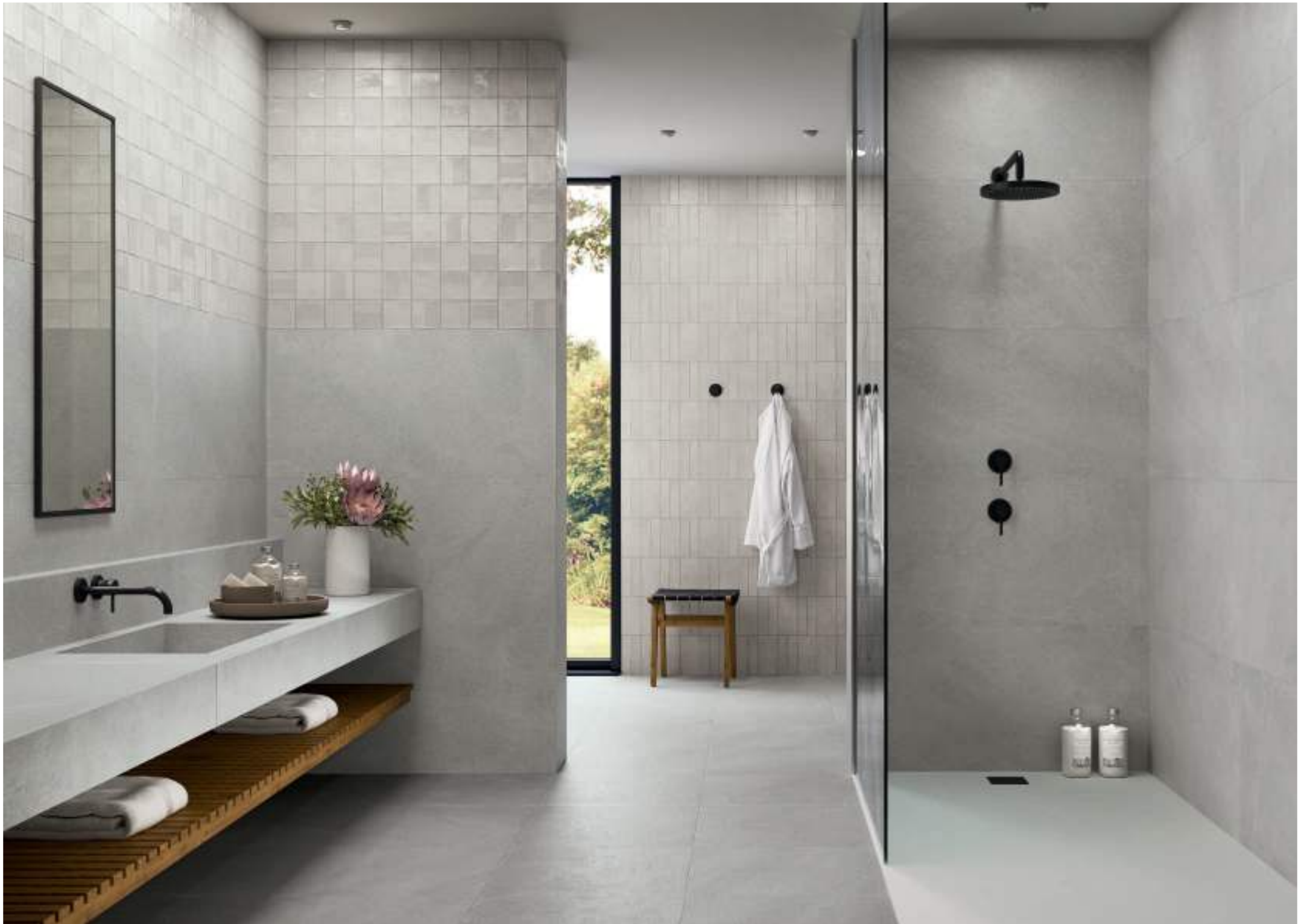
DOWNTOWN PEARL 11,5X11,5 / BURLINGTON GREY 60X120