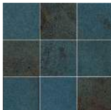
NIAGARA BLUE 15X15 / 6"X6"