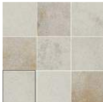
NIAGARA WHITE 15X15 / 6"X6"