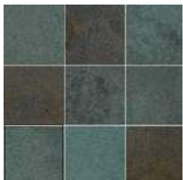
NIAGARA GREEN 15X15 / 6"X6"