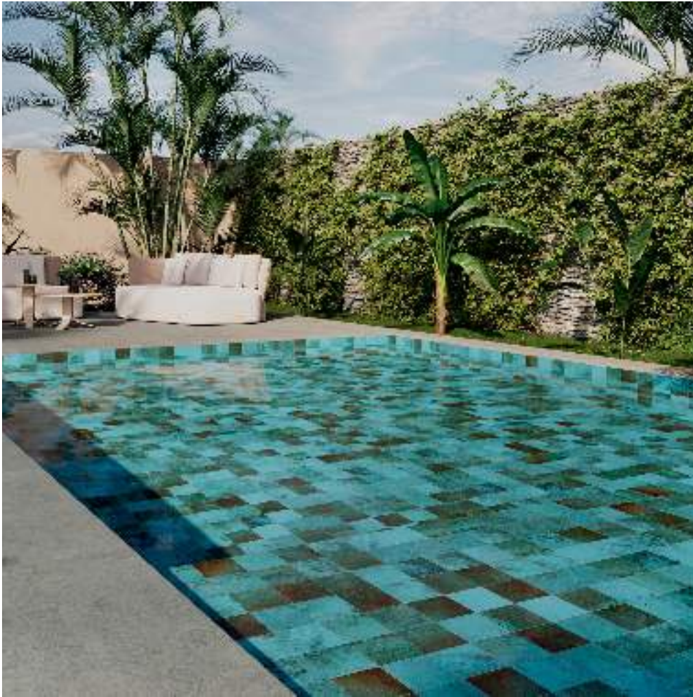
NIAGARA GREEN 15X15