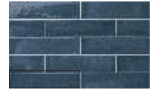
STARDUST NAIVE 6X25 / 2,5"X10" J46/M