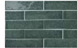
STARDUST GREEN 6X25 / 2,5"X10" J46/M