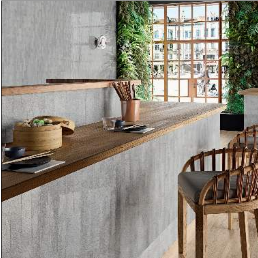
STARDUST GREY 6X25 / SEQUOIA BIRCH RECT 25X150