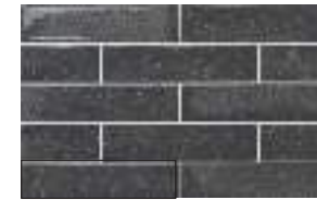
STARDUST NERO 6X25 / 2,5"X10" J46/M