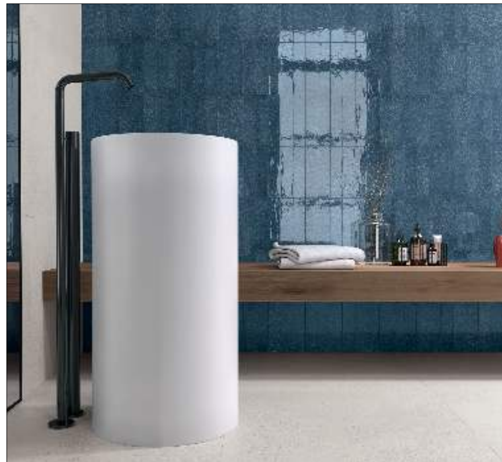
STARDUST NAIVE 6X25 / ILLINOIS WHITE RECT 75X75