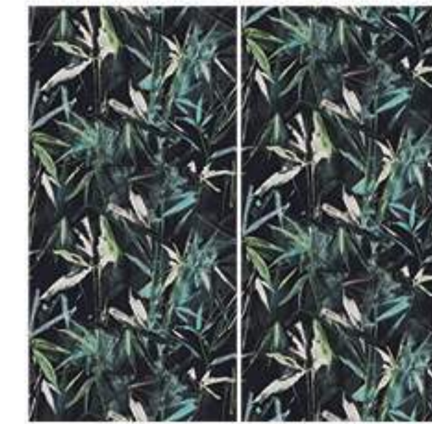
0451040 BAMBU SKETCH 120x120 Composizione: 2 pz. A+B - 60x120