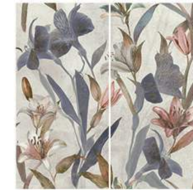
0451036 LILIUM 120x120 Composizione: 2 pz. A+B - 60x120