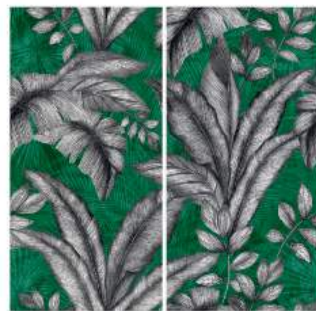
0451059 CLOROFILLA 120x120 Composizione: 2 pz. A+B - 60x120