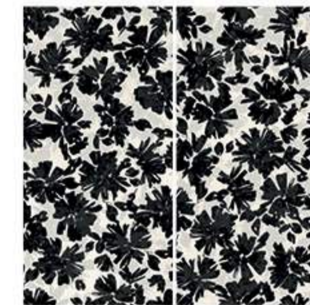
0451014 BLACK FLOWERS 120x120 Composizione: 2 pz. A+B - 60x120