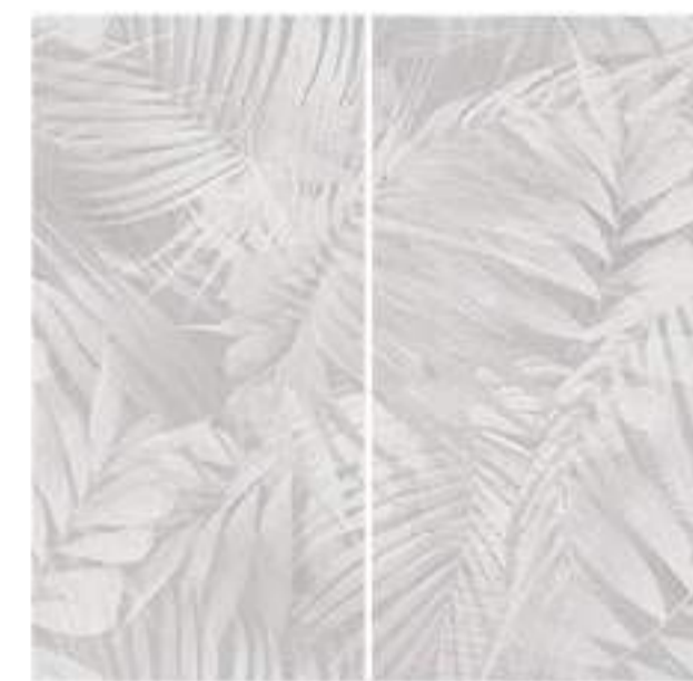
0451035 COTTON GARDEN 120x120 Composizione: 2 pz. A+B - 60x120