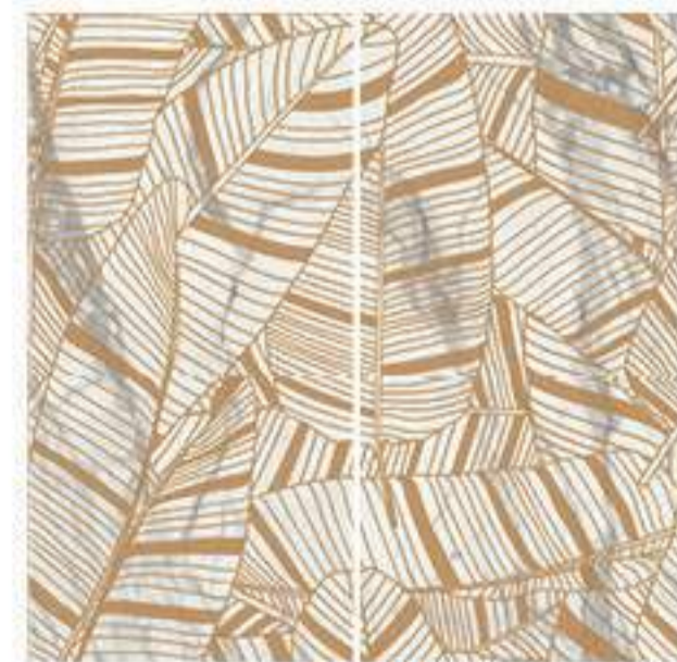
0451032 INCANTO 120x120 Composizione: 2 pz. A+B - 60x120