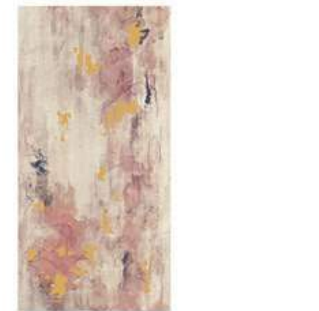
0451005 PAINT 60x120