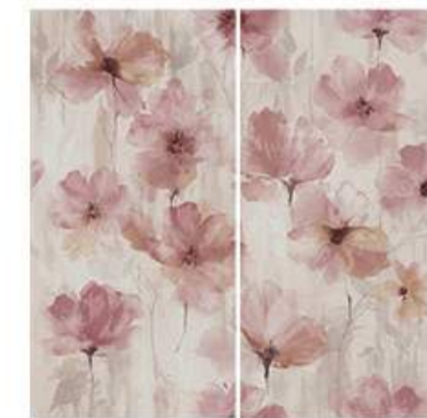
0451003 POETICA 120x120 Composizione: 2 pz. A+B - 60x120