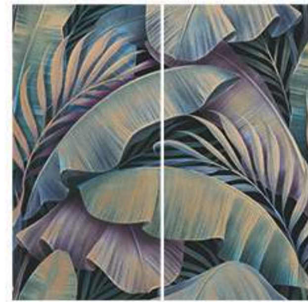
0451037 TEMPTATION 120x120 Composizione: 2 pz. A+B - 60x120