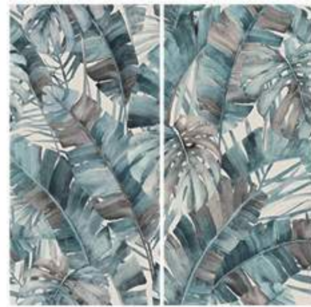
0451031 RAIN FOREST 120x120 Composizione: 2 pz. A+B - 60x120