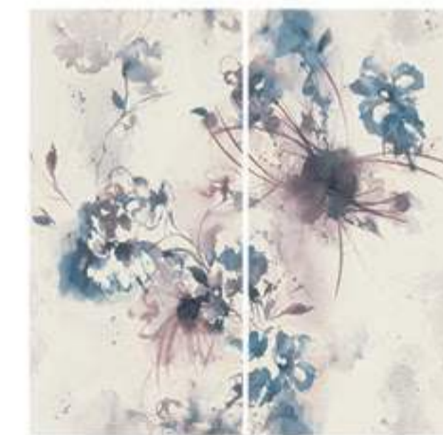
0451016 MEMORIE 120x120 Composizione: 2 pz. A+B - 60x120