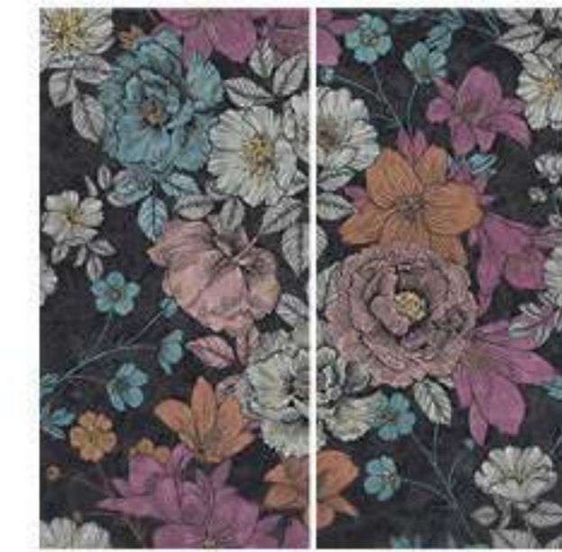
0451042 WONDERLAND 120x120 Composizione: 2 pz. A+B - 60x120