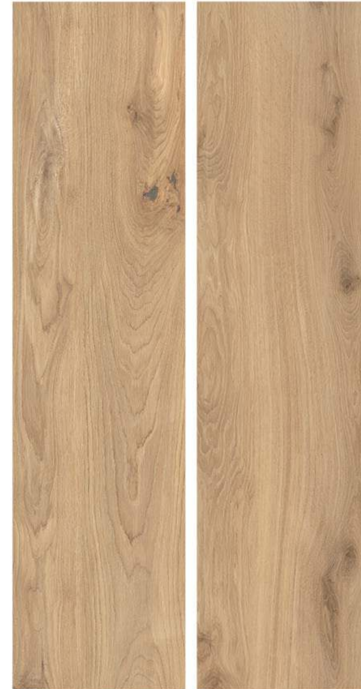
BEIGE 0698019 30x120