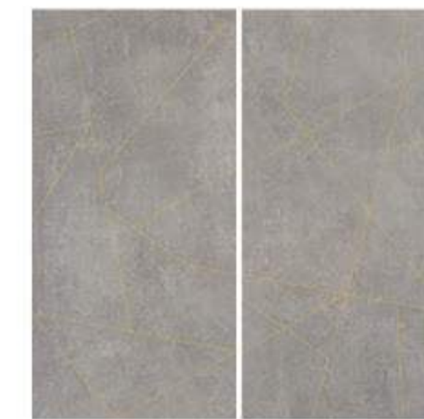
0451017 GOLD LINE CEMENTO 120x120 Composizione: 2 pz. A+B - 60x120