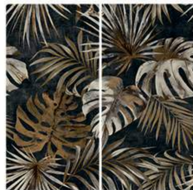
0451012 GOLDEN LEAVES 120x120 Composizione: 2 pz. A+B - 60x120