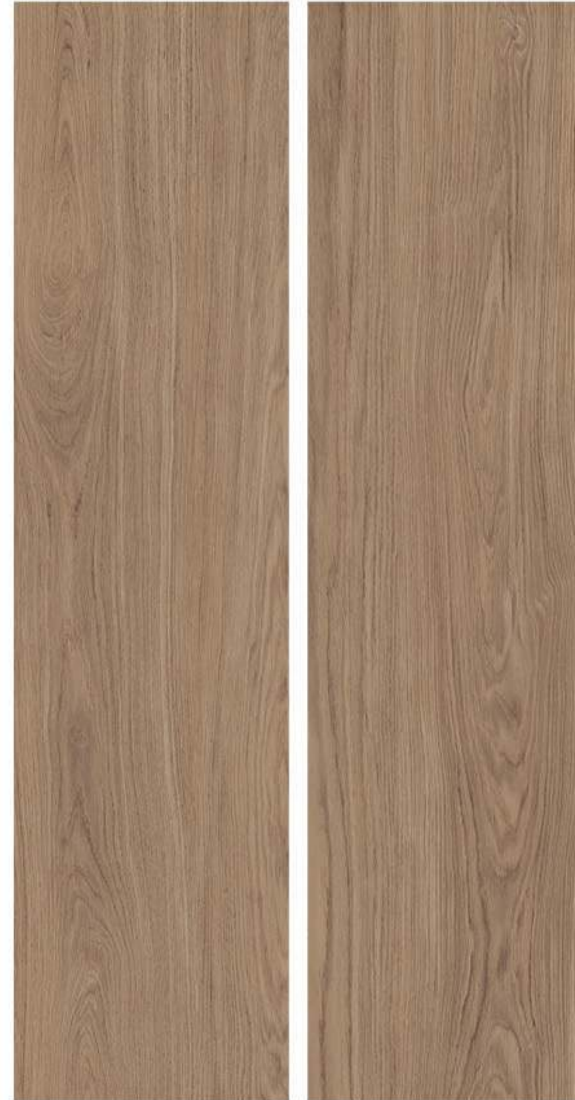
WALNUT 0698018 30x120