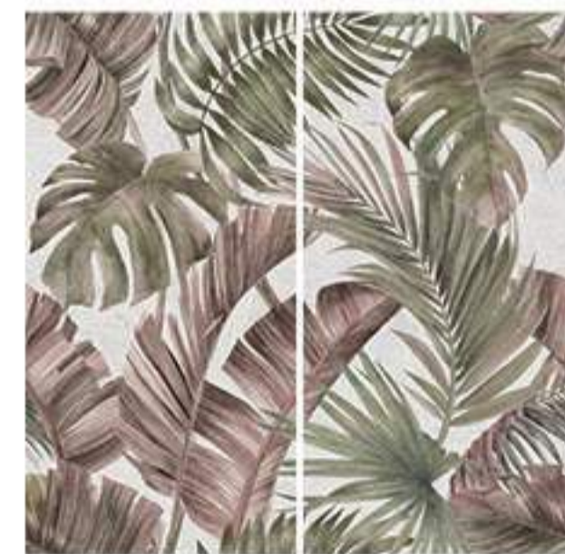
0451038 FANCY WALL 120x120 Composizione: 2 pz. A+B - 60x120