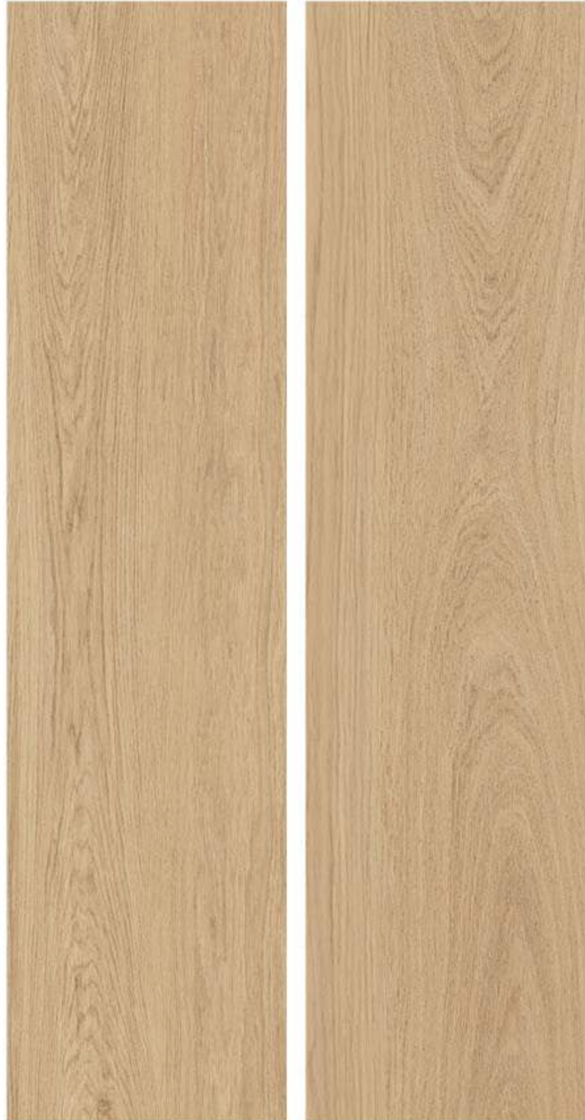
BEIGE 0698017 30x120