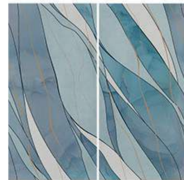
0451041 ICELAND 120x120 Composizione: 2 pz. A+B - 60x120