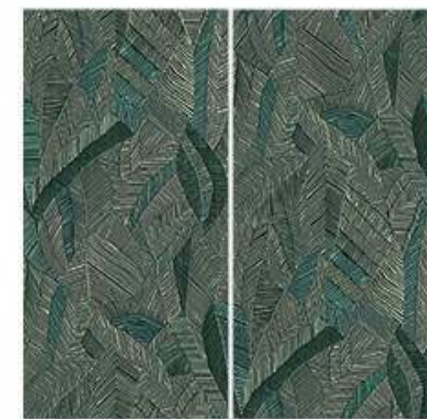
0451034 WILD ATELIER 120x120 Composizione: 2 pz. A+B - 60x120