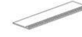
30x120 GRADONE STEP