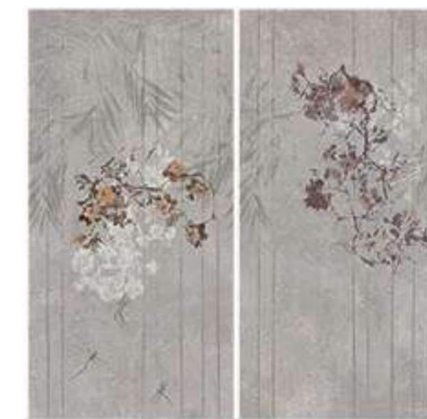
0451002 CHARME 120x120 Composizione: 2 pz. A+B - 60x120