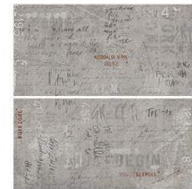
0451013 GRAFFITI 120x120 Composizione: 2 pz. A+B - 60x120