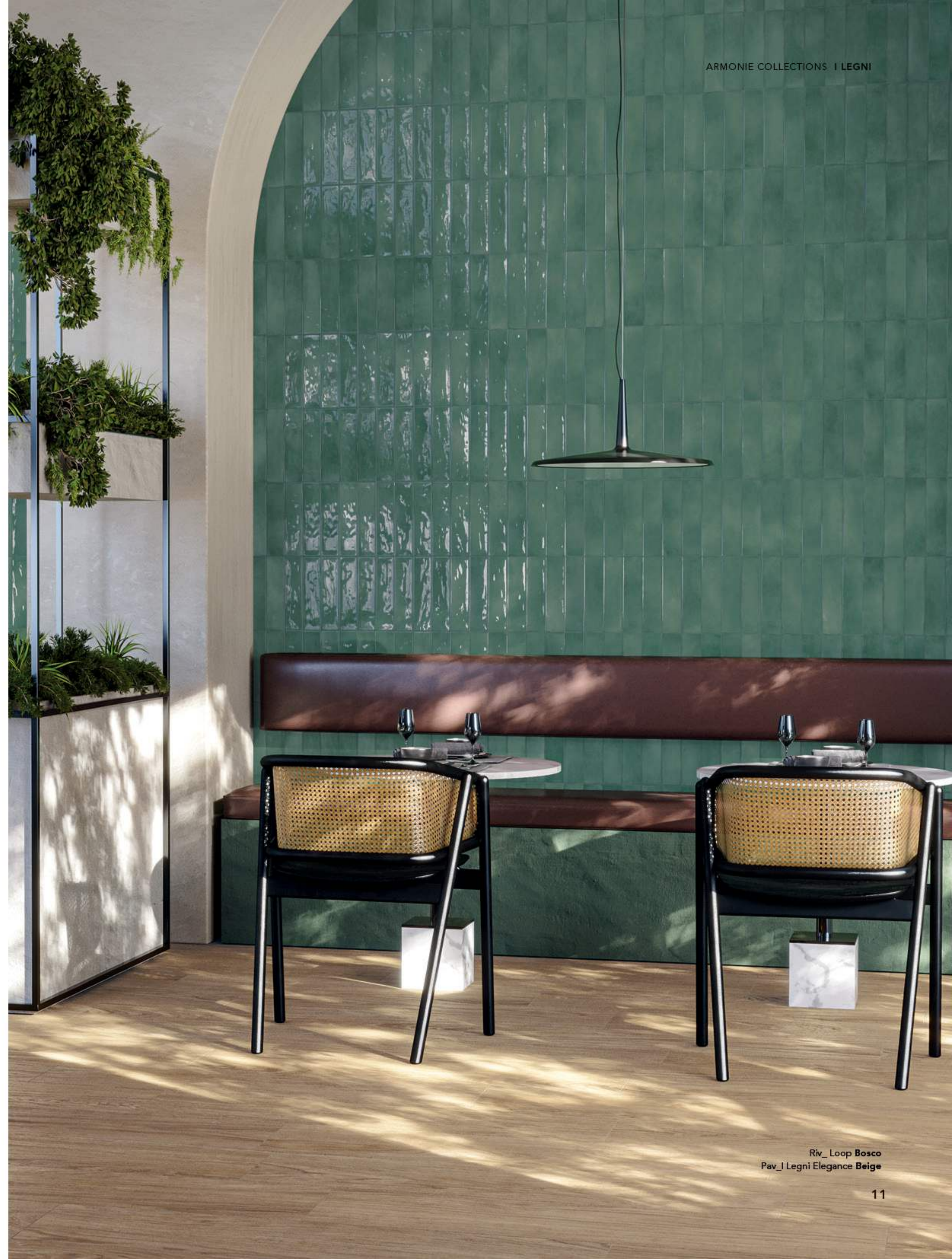
Riv_Loop Bosco Pav_I Legni Elegance Beige