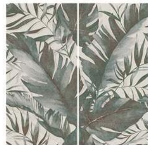
0451001 SAVAGE 120x120 Composizione: 2 pz. A+B - 60x120