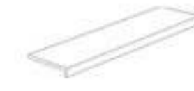
30x120x5 ELEMENTO "L"