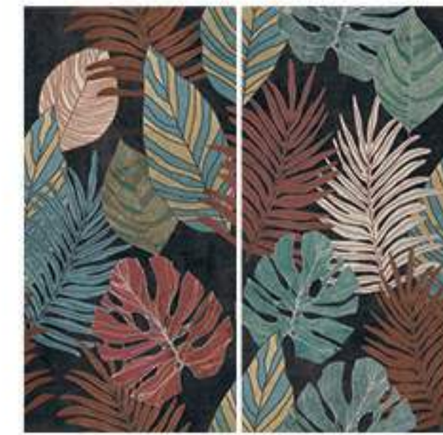
0451011 POP GARDEN 120x120 Composizione: 2 pz. A+B - 60x120