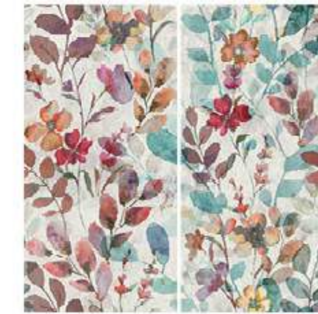
0451064 WILDFLOWERS 120x120 Composizione: 2 pz. A+B - 60x120