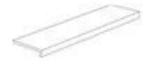
30x120x5 ELEMENTO "L"