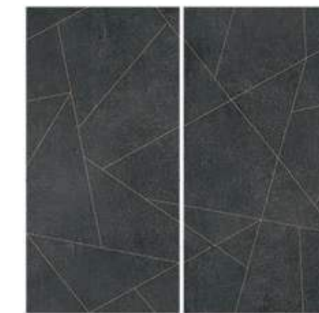
0451018 GOLD LINE ARDESIA 120x120 Composizione: 2 pz. A+B - 60x120