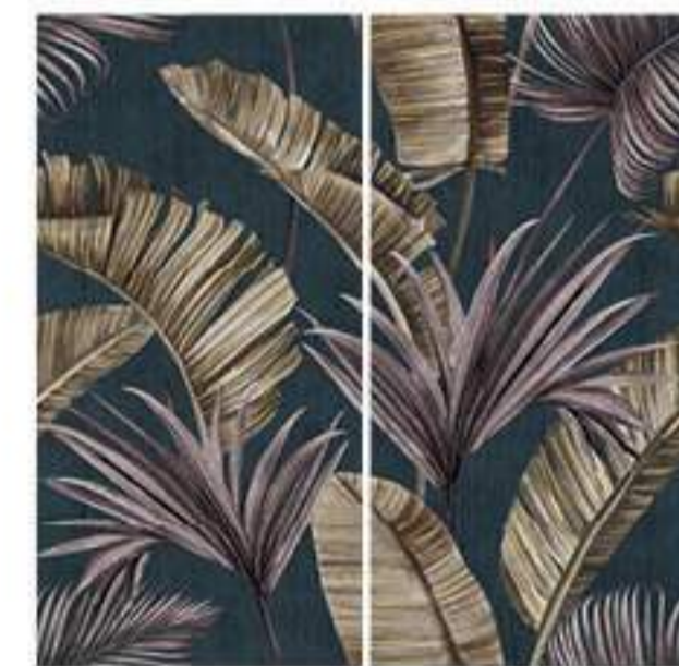
0451033 PURPLE CHIC 120x120 Composizione: 2 pz. A+B - 60x120