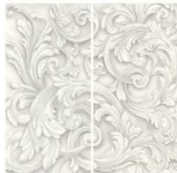
0451063 VENUS 120x120 Composizione: 2 pz. A+B - 60x120