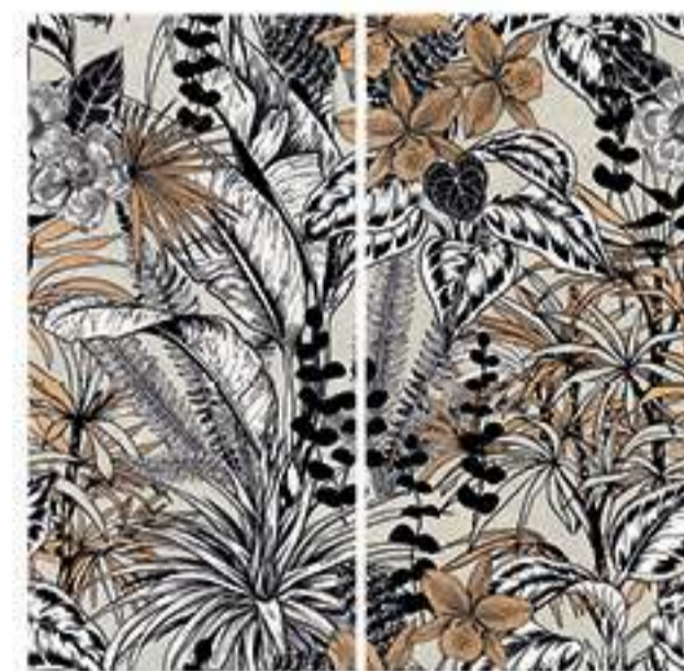
0451039 MACROPHILLA 120x120 Composizione: 2 pz. A+B - 60x120