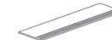
30x120x2 GRADONE STEP

PEZZI SPECIALI / Special pieces / Pièces spéciales / Formteile