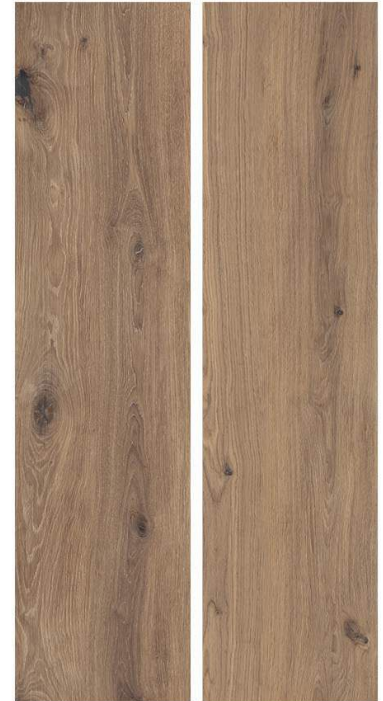
WALNUT 0698020 30x120