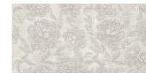
0451004 ROMANCE 60x120