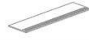
30x120 GRADONE STEP