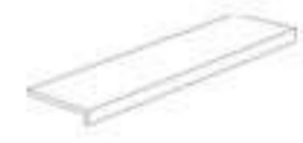
30x120x5 ELEMENTO "L"