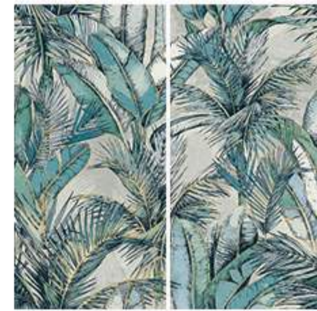
0451015 EDEN 120x120 Composizione: 2 pz. A+B - 60x120