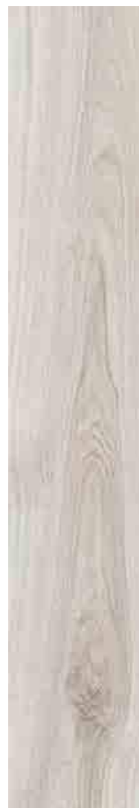
SILVERWOOD BIANCO 20x120 ▲ 51