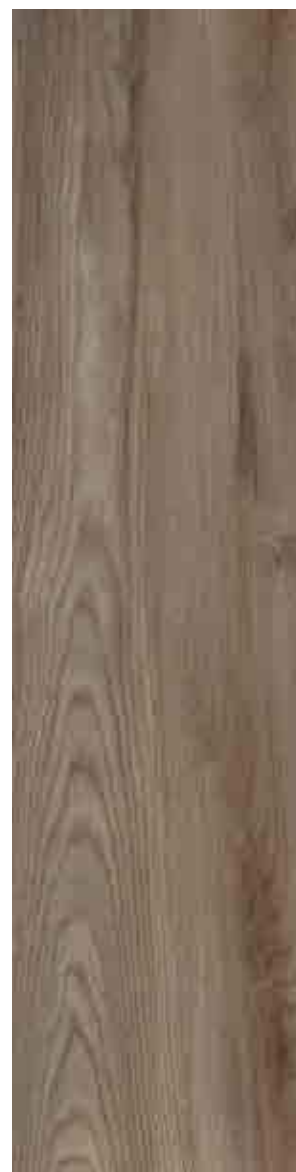
SILVERWOOD TORTORA 30x120 ▲ 51