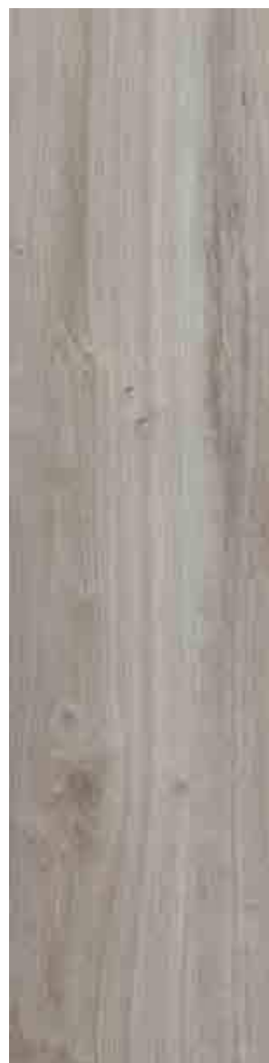
SILVERWOOD GRIGIO 30x120 ▲ 51