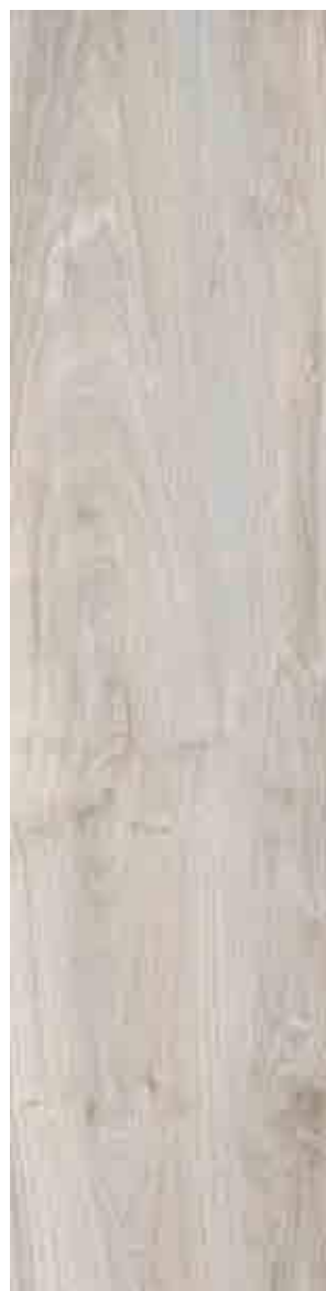
SILVERWOOD BIANCO 30x120 ▲ 51

RETTIFICATO Rectified - Rectifié - Rektifiziert UNI EN 14411 - G Bla