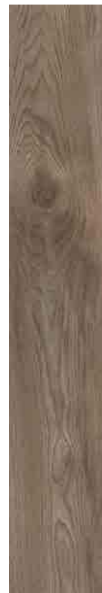
SILVERWOOD TORTORA 20x120 ▲ 51