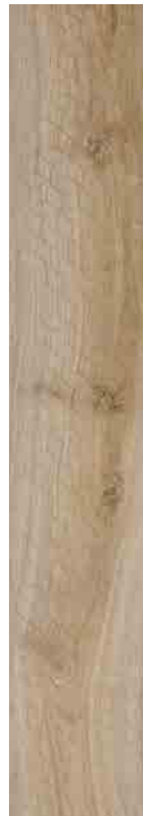
SILVERWOOD MIELE 30x120 ▲ 51 SILVERWOOD MIELE 20x120 ▲ 51 SILVERWOOD INSERTO MIELE 20x120 ▲ 55