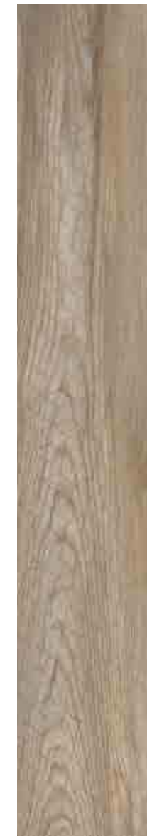
SILVERWOOD NOCCIOLA ▲ 51 SILVERWOOD NOCCIOLA ▲ 51 SILVERWOOD INSERTO ▲ 55 30x120 20x120 NOCCIOLA 20x120