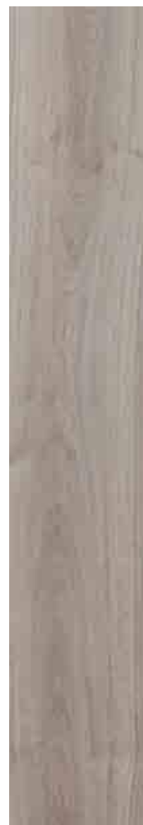
SILVERWOOD GRIGIO 20x120 ▲ 51