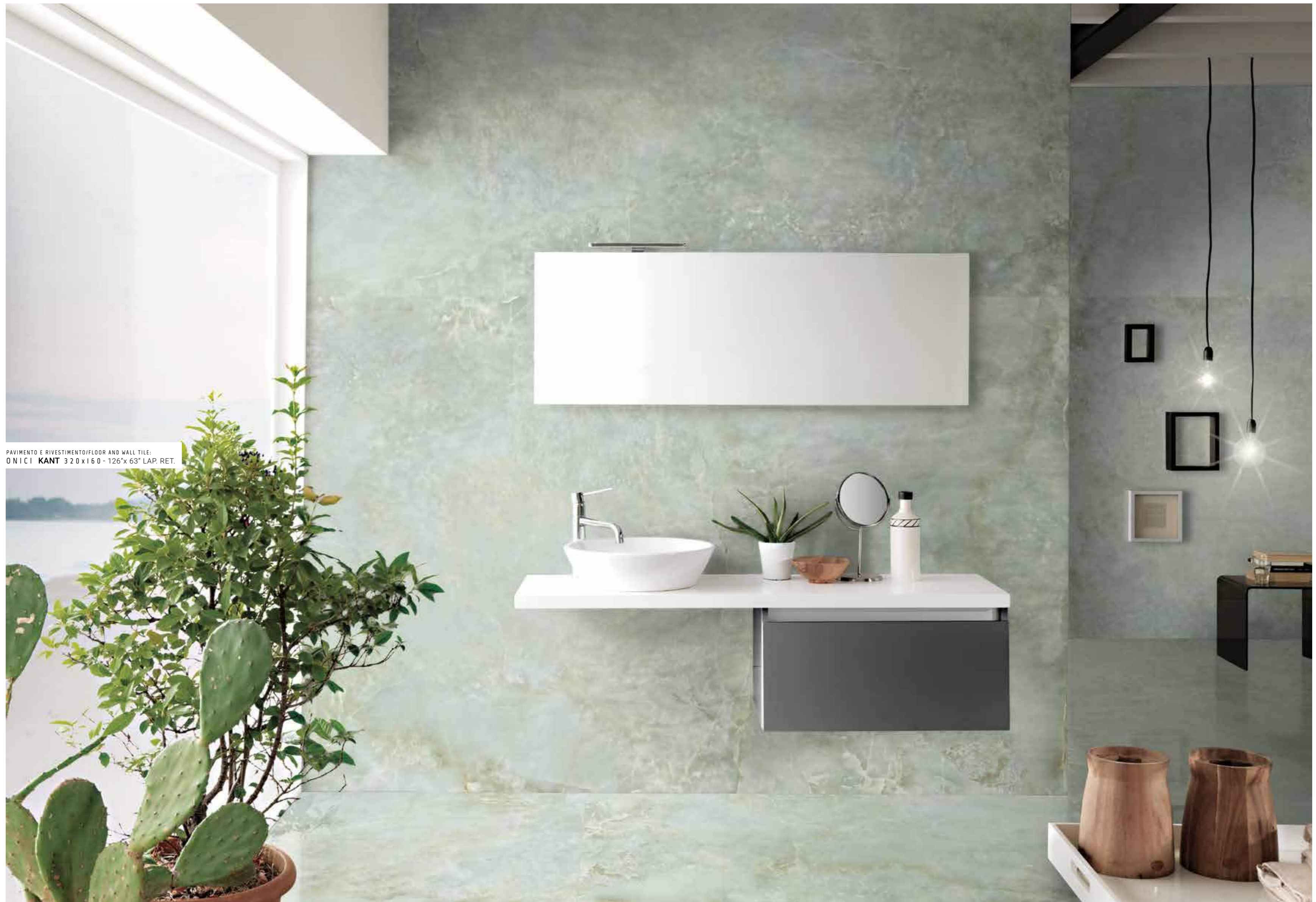
PAVIMENTO E RIVESTIMENTO/FLOOR AND WALL TILE: ONICI KANT 320 x 160 - 126"x 63" LAP. RET.