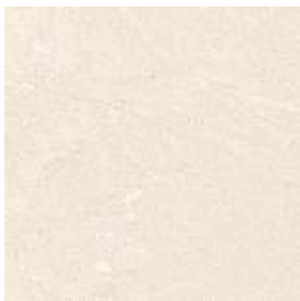
NATURE BONE PR6060LB