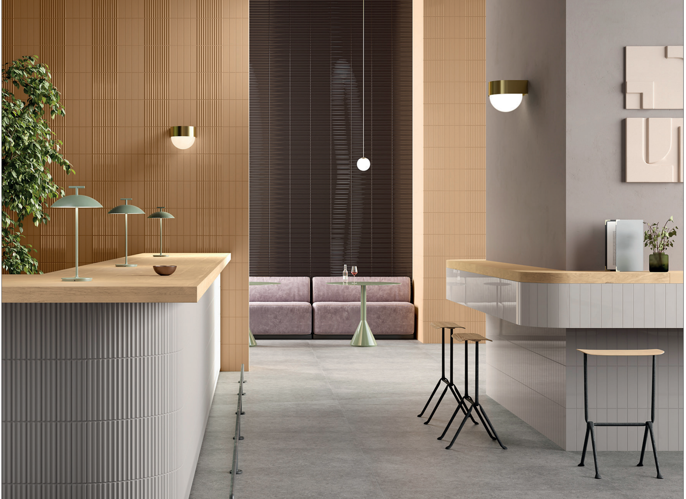
HALL, rivestimento / covering TUBES 1M - TUBES 1FM - TUBES 4M - TUBES 4FL - TUBES 3M (6x25 cm - 2 3 / 8 "x10") pavimento / floor CLAYBORN 3 (60x120 cm - 24"x48")