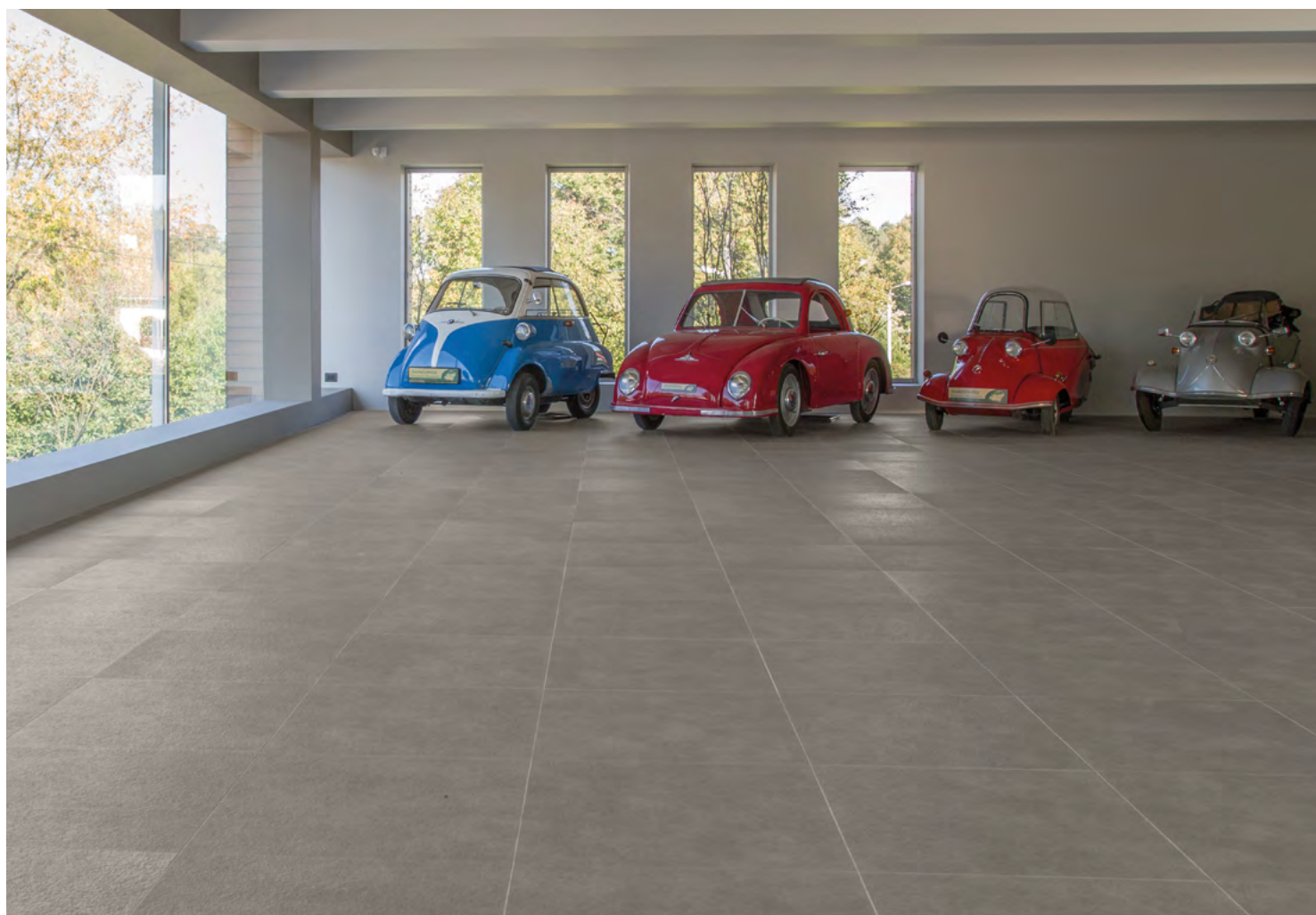
FLOOR: kerblock piombo cm 60x60 - 23 5/8 "x23 5/8 "

Caractéristiques techniques et esthétiques à la page : Technische und ästhetische Eigenschaften auf Seite: 480