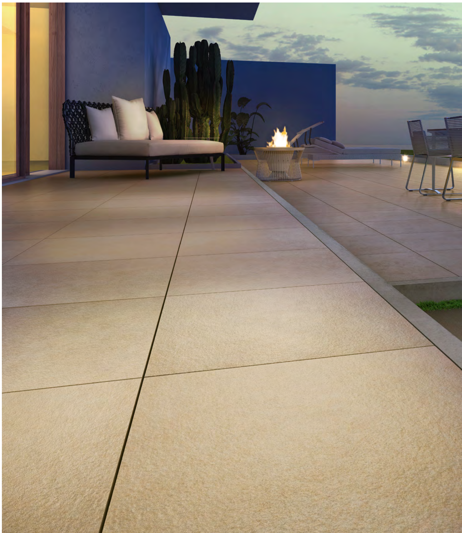
FLOOR: kerblock beige cm 60x60 - 23 5/8 "x23 5/8 "