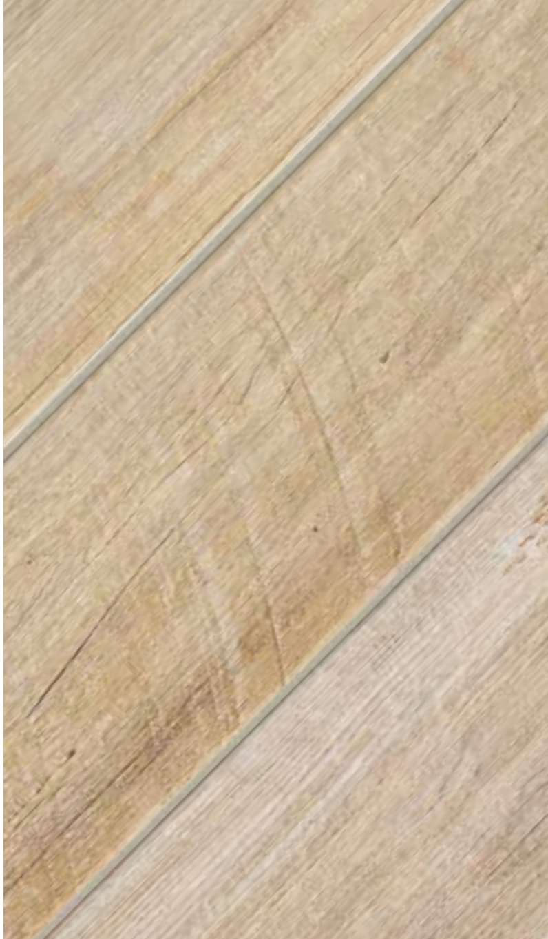
Beige fusion* 1560FSN002 15x60 - 6"x24"