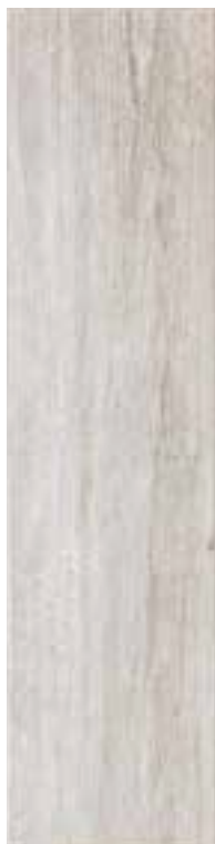
1560FSN001 FUSION WHITE 15x60 - 6"x24"