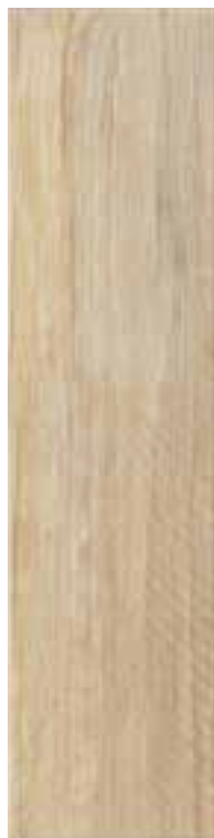
1560FSN002 FUSION BEIGE 15x60 - 6"x24"