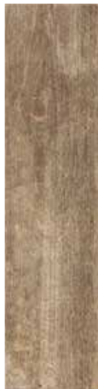
1560FSN004 FUSION TAUPE 15x60 - 6"x24"