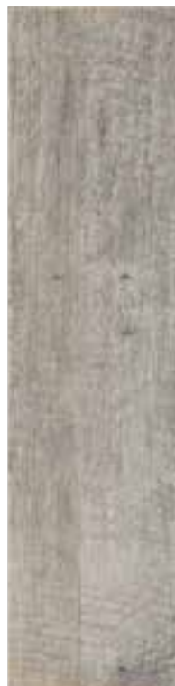
1560FSN003 FUSION GREY 15x60 - 6"x24"