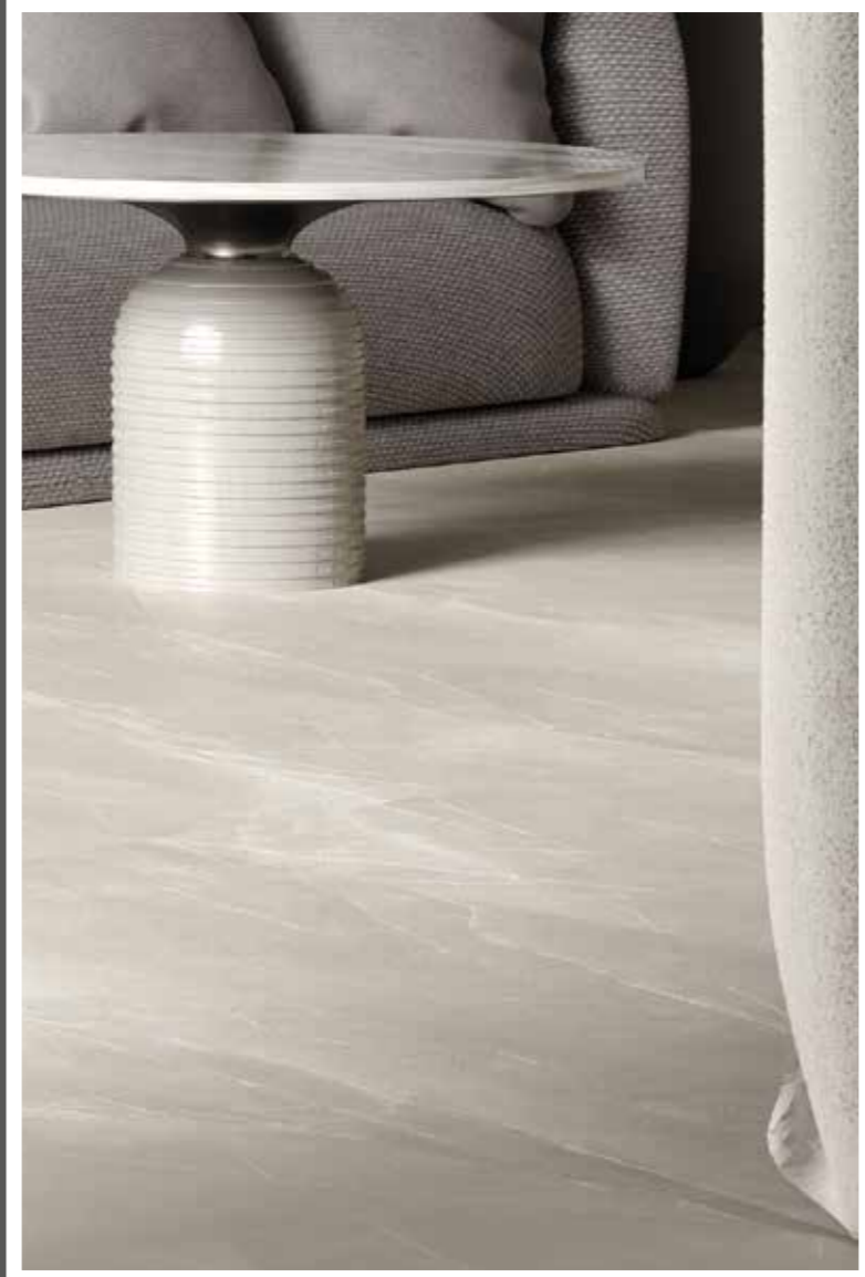
PULPIS SILVER 60x120 24"x48"