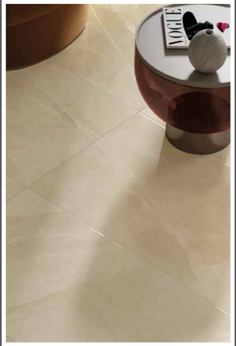
PULPIS BEIGE 60x120 24"x48"