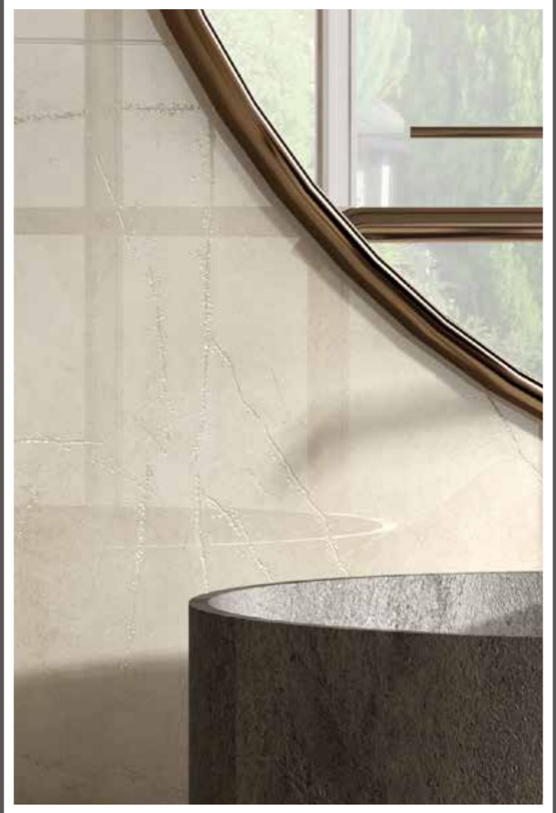
PULPIS ALMOND 60x120 24"x48"