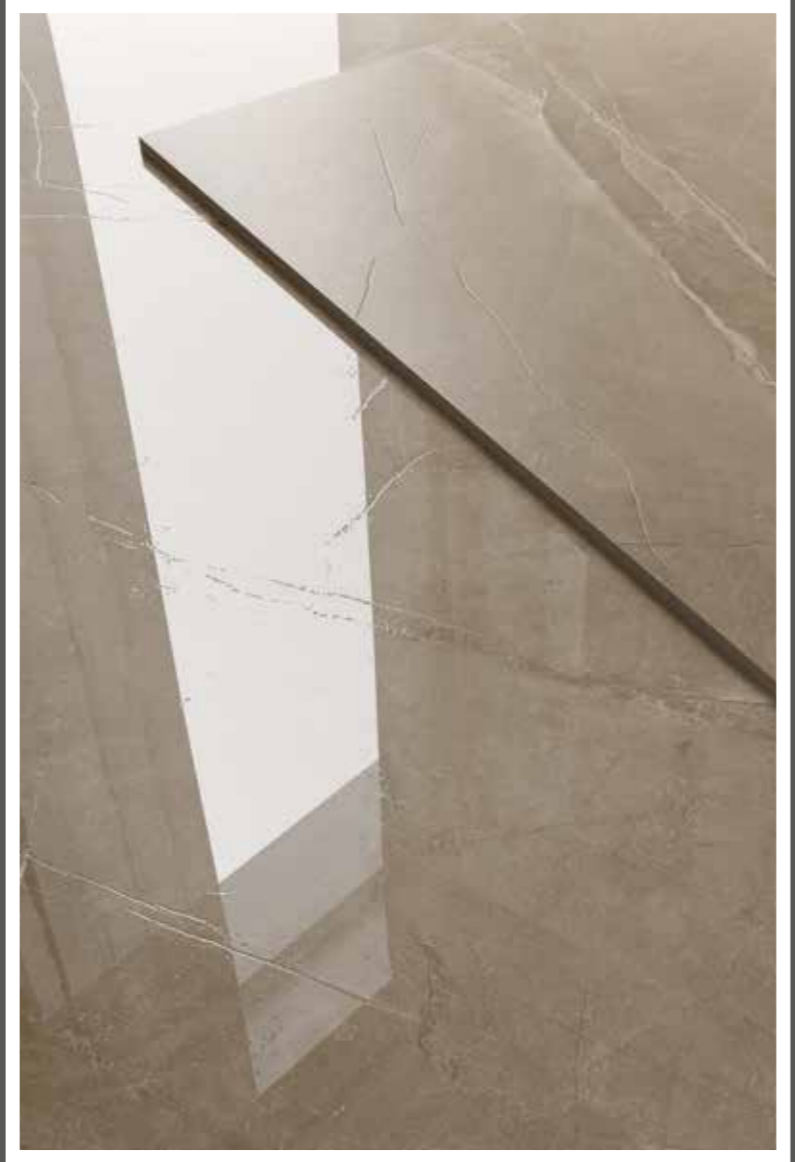
PULPIS TAUPE 60x120 24"x48"