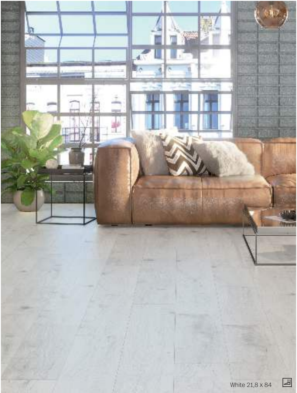
White 21,8 x 84