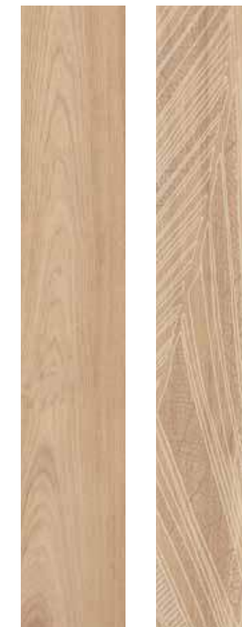
SR 11 Rett. 20x180 cm 8x71 in 146