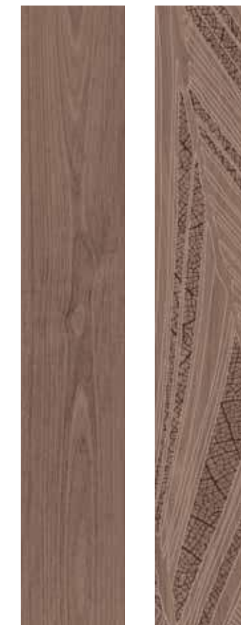
SR 9 Rett. 20x180 cm 8x71 in 146