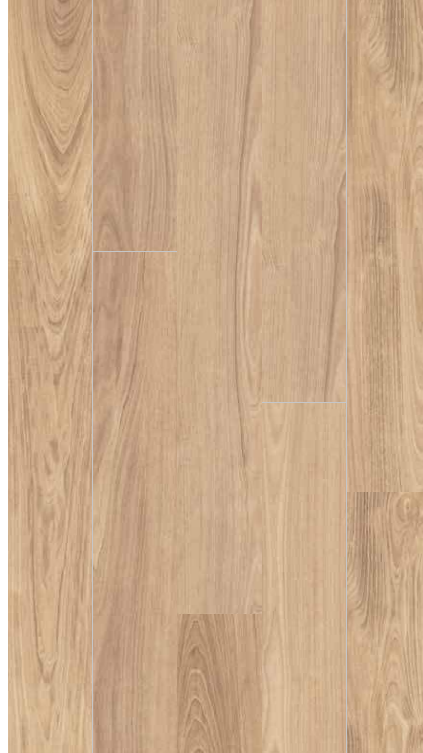
SR 11 Rett.