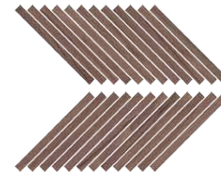
Mosaico / SR 9 30x30 cm 12x12 in 293 3 + 3