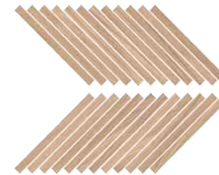
Mosaico / SR 11 30x30 cm 12x12 in 293 3 + 3