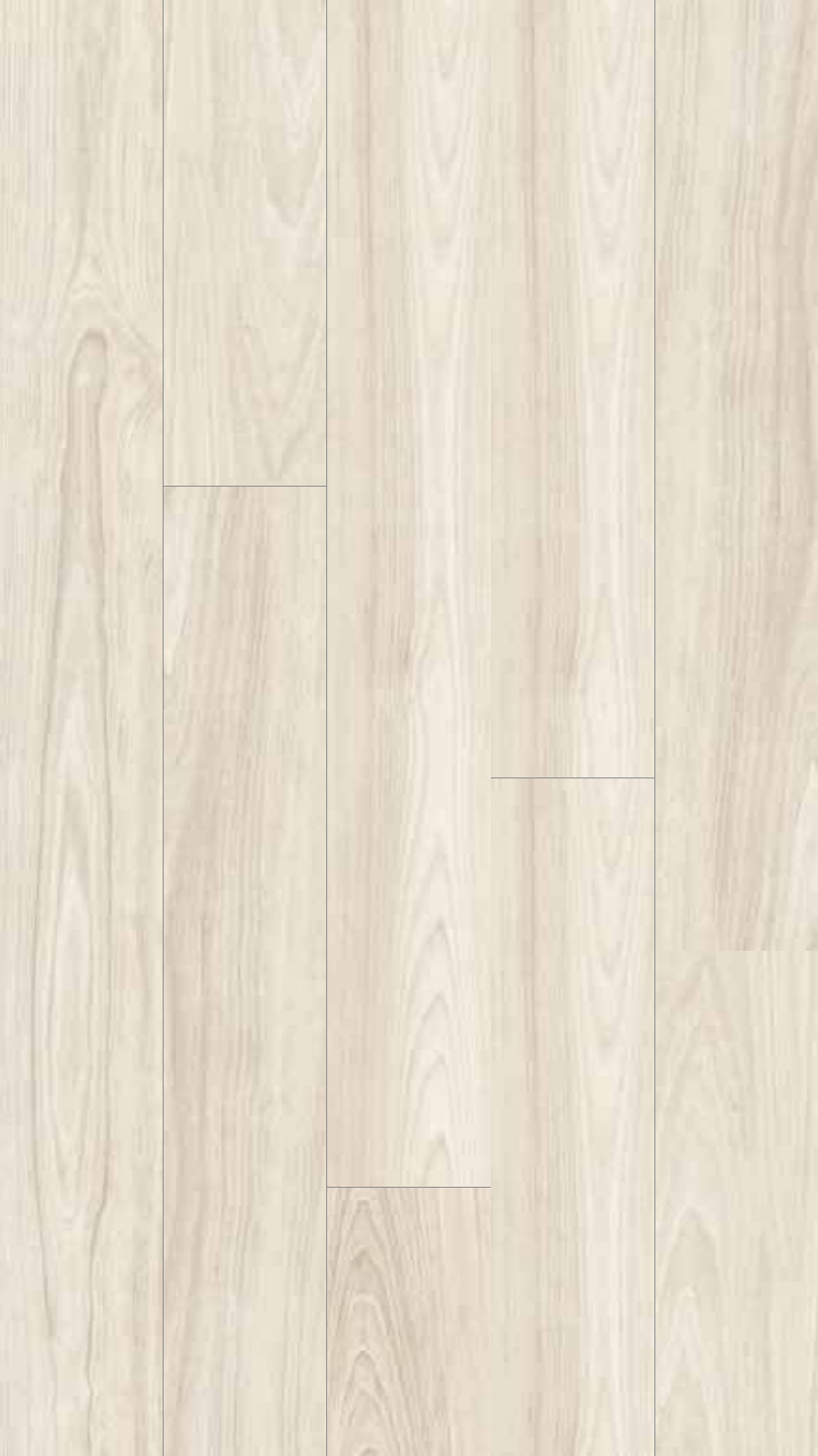
SR 10 Rett.