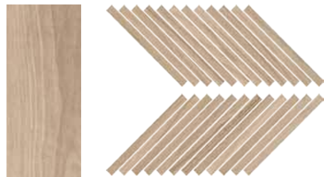
Mosaico / SR 1 30x30 cm 12x12 in 293 3 + 3