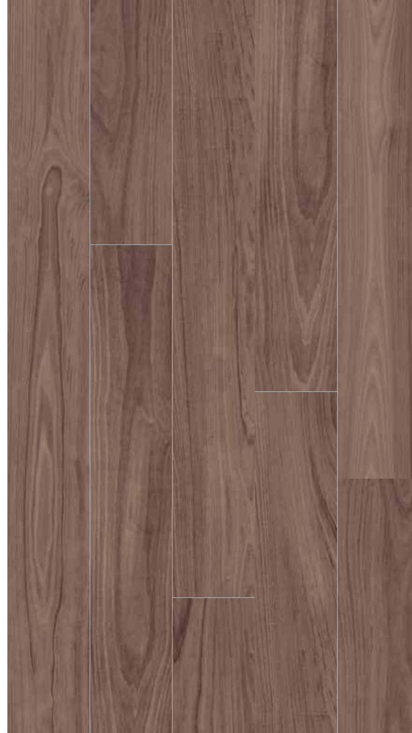
SR 9 Rett.