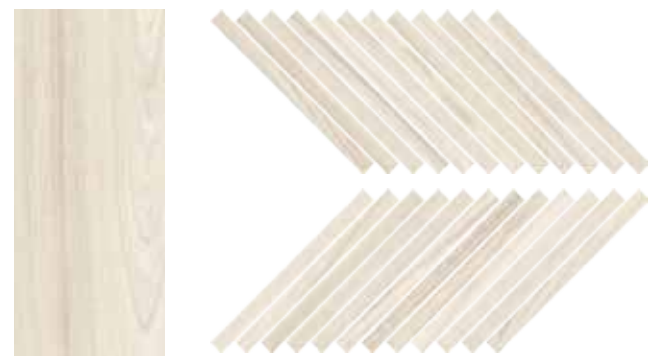
Mosaico / SR 10 30x30 cm 12x12 in 293 3 + 3