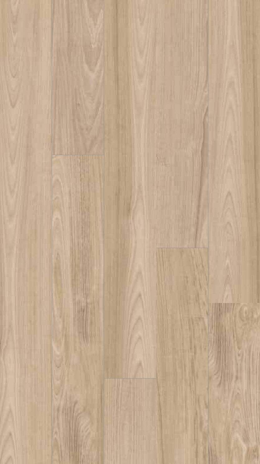
SR 1 Rett.