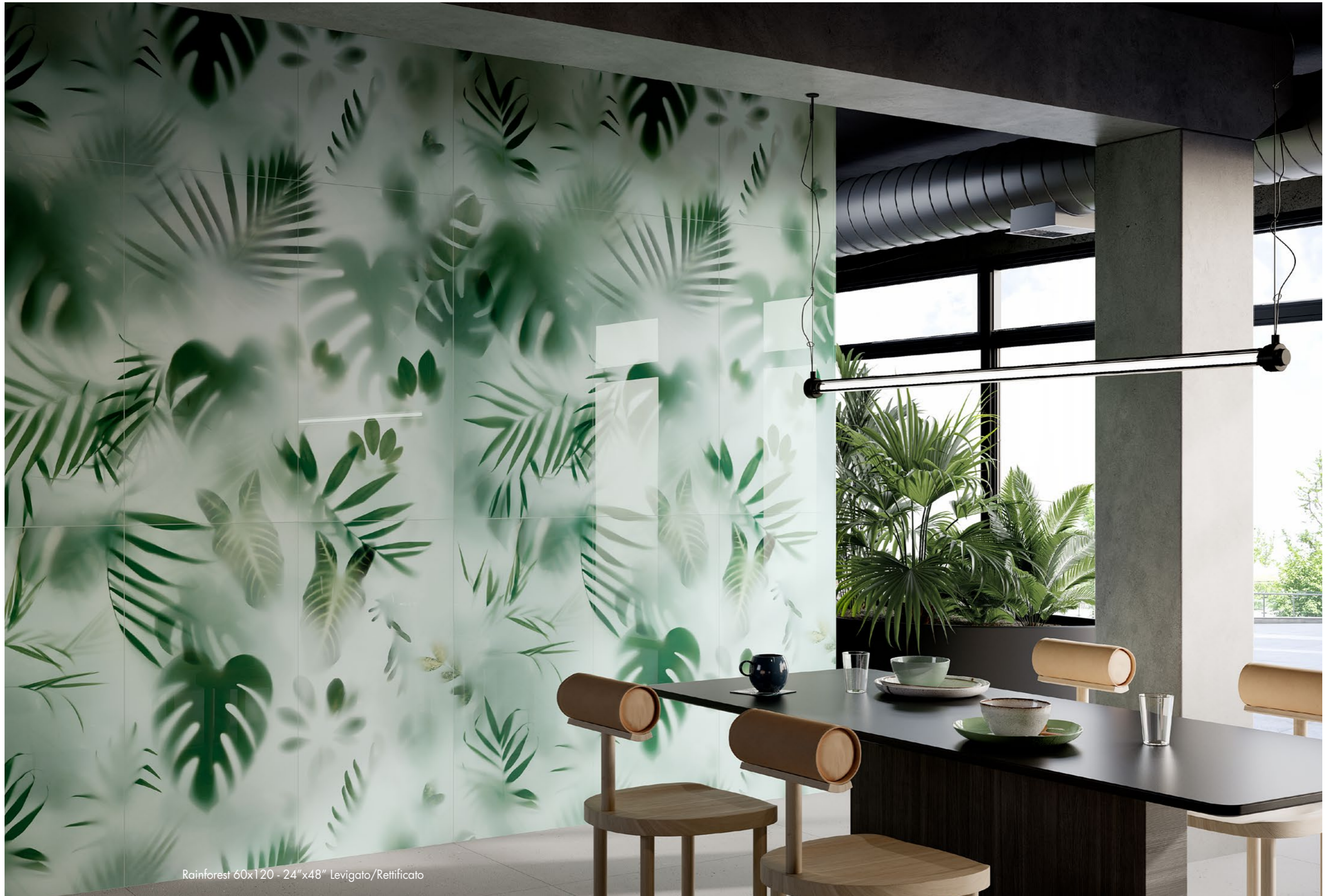
Rainforest 60x120 - 24"x48" Levigato/Rettificato