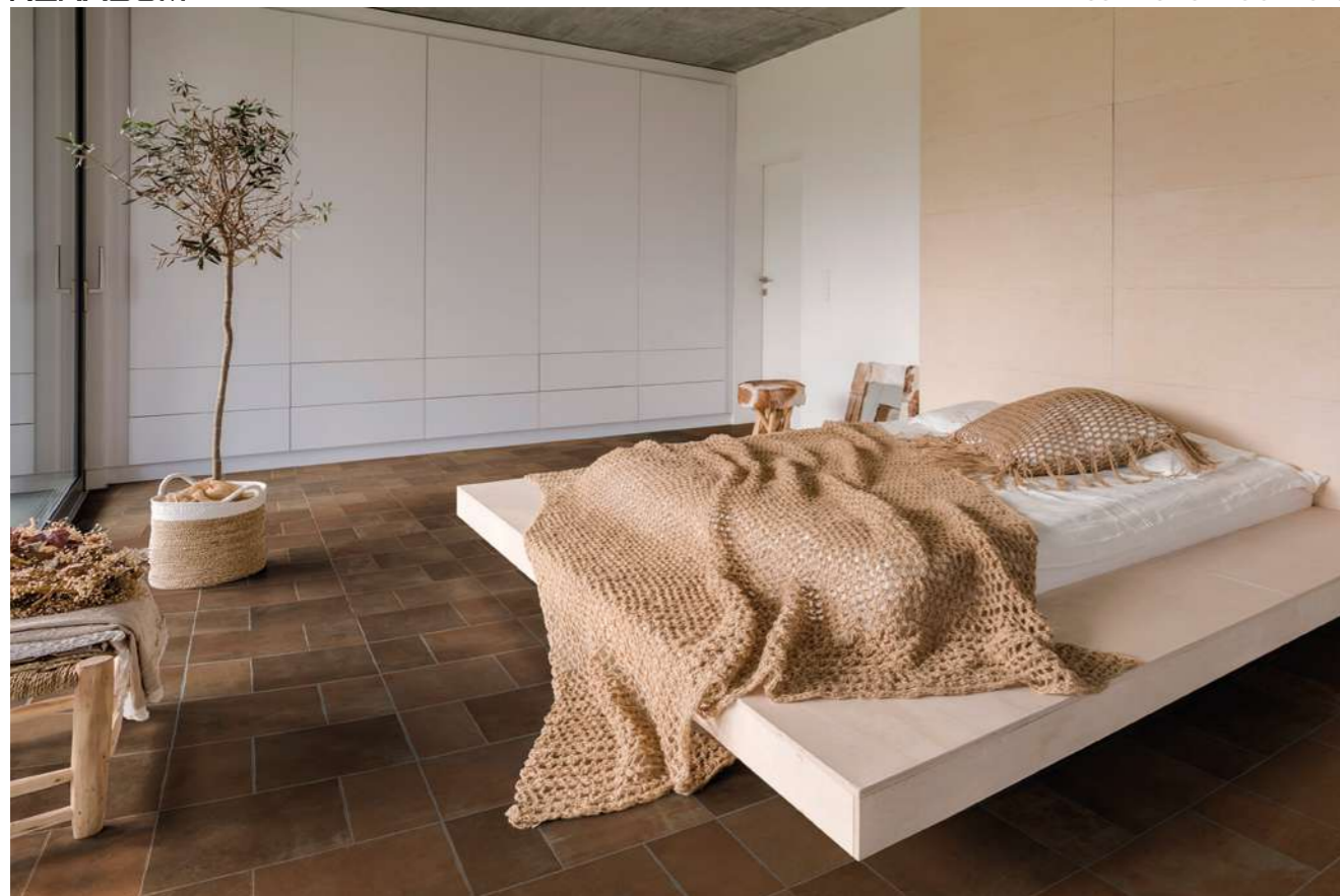
floor Noce 25x25 10"x10" - 12,5x25 5"x10"