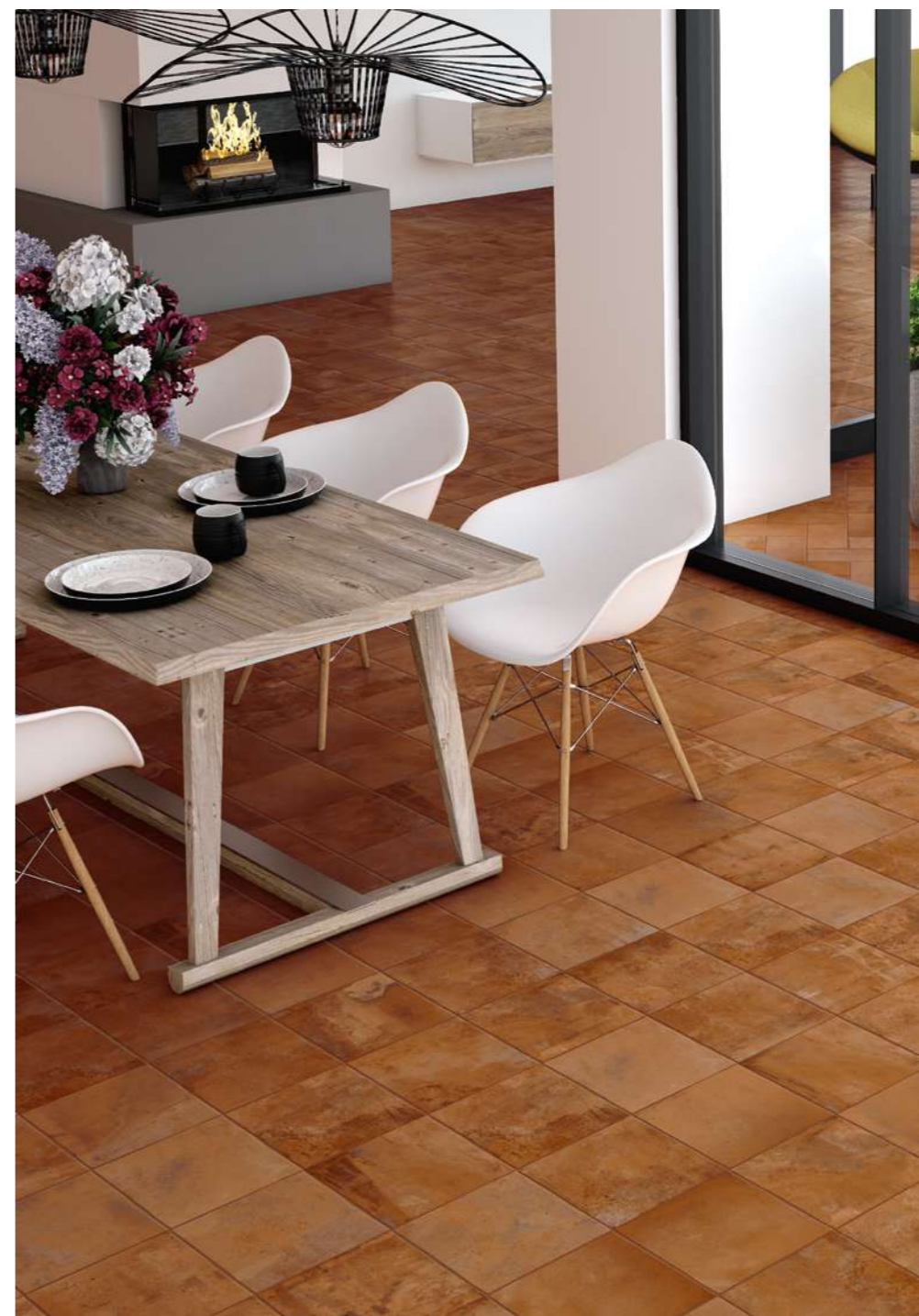
floor Rosso 25x25 10°x10°

Inspiziert vom Charme eines Klassikers der italienischen Architektur, in einer Feinsteinzeugkollektion, die ihm eine neue zeitgenössische Energie verleiht. Die Farbschattierungen sind kompakt und gleichmäßig, die Grafiken werden durch Bereiche glänzender Oberflächen verstärkt, die wie ein Glanz einem traditionellen Klassiker neues Licht verleihen.