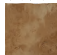
2525KCONOC ■ M19