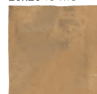
2525KCOOCR ■ M19