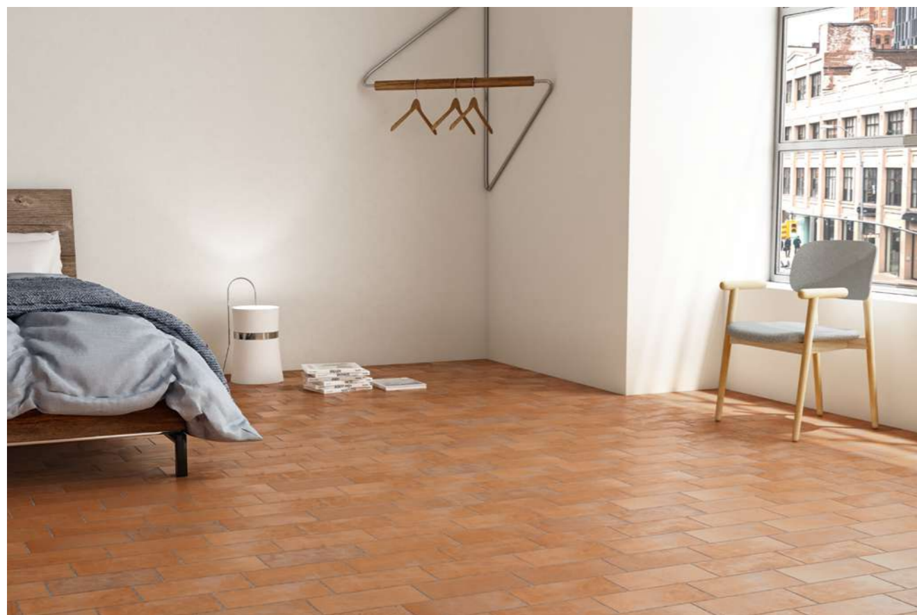
floor Arancio 12,5x25 5x10"