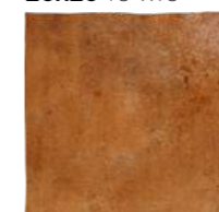
2525KCOROS ■ M19