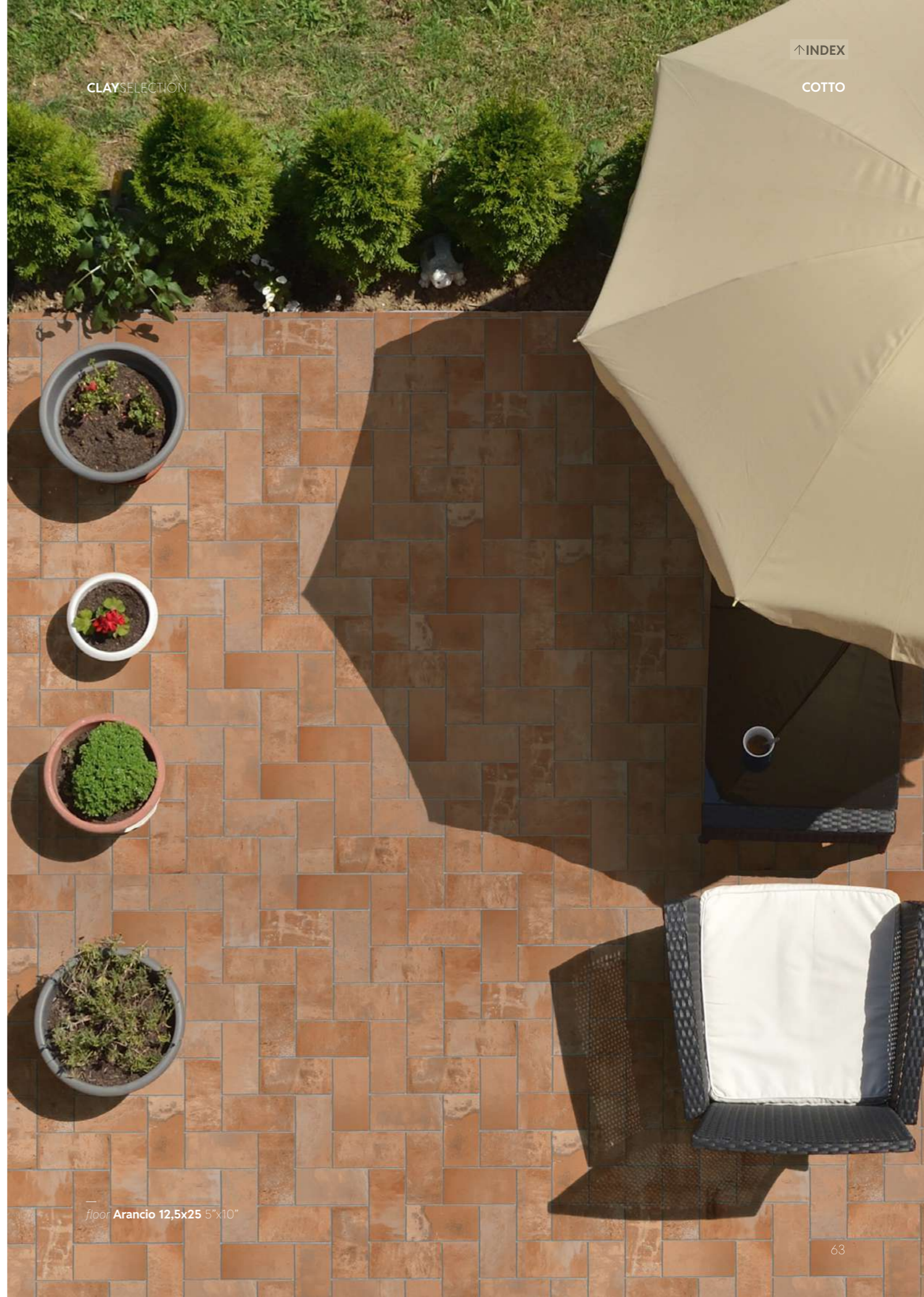
floor Arancio 12,5x25 5"x10"