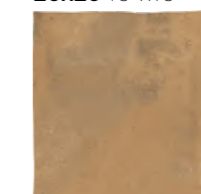
2525KCOARA ■ M19