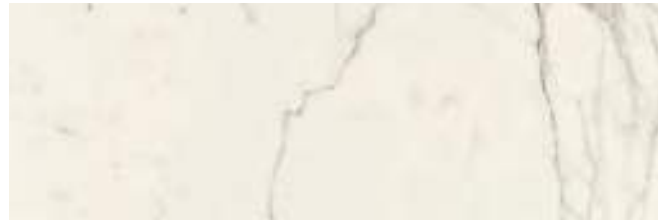
MMHQ Allmarble Statuario20 40x120