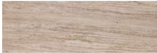
MMHR Allmarble Travertino20 40x120

Conforme • According to • Conforme • Gemäß • Conforme • Соответствует UNI EN 14411 - G B1a