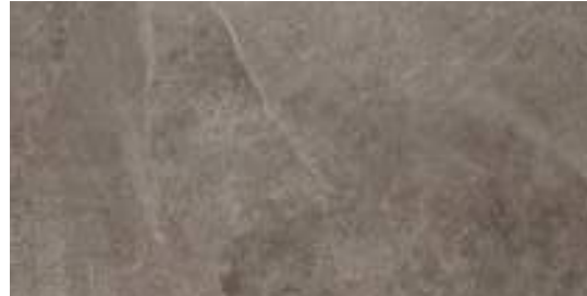
M06V Ardesia20 Cenere Rett.

Formati • Sizes • Formats • Formate • Formatos • Форматы