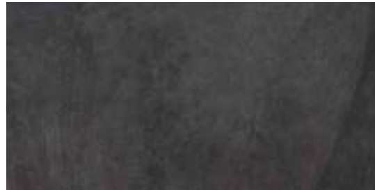
M06W Ardesia20 Antracite Rett.