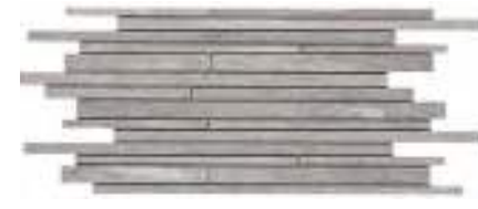
MLWU Mosaico Strutturato 30x60 (2)