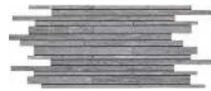
MLWS Mosaico Strutturato 30x60 (2)

Formati • Sizes • Formats • Formate • Formatos • Форматы