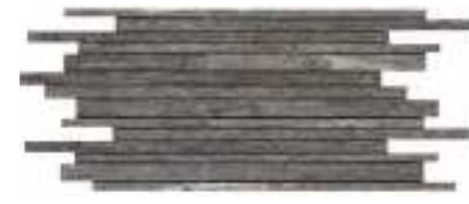
MLWT Mosaico Strutturato 30x60 (2)