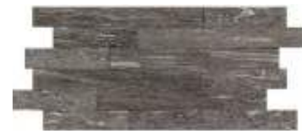
MLWW Mosaico 30x60