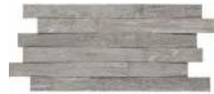
MLWV Mosaico 30x60