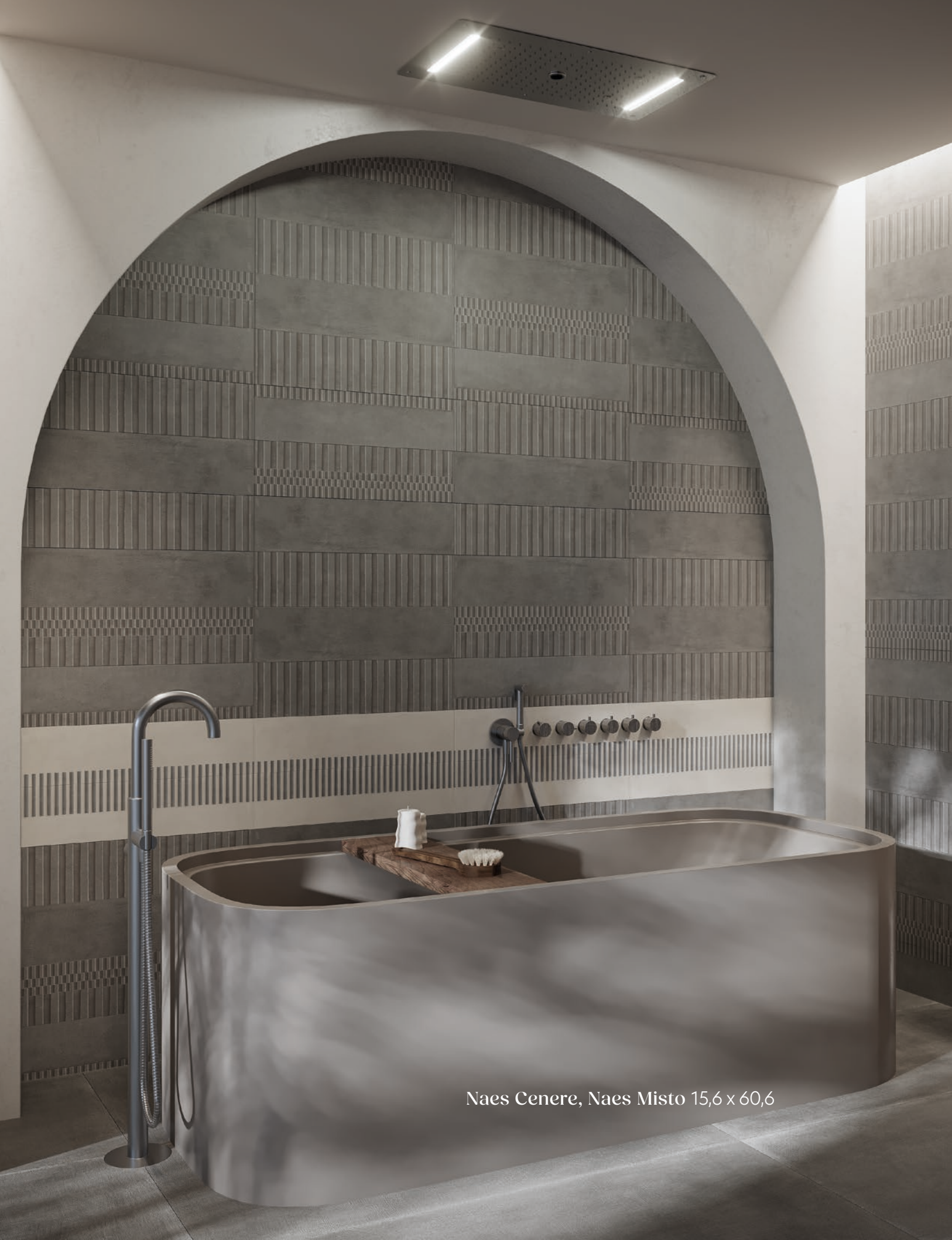
Naes Cenere, Naes Misto 15,6 x 60,6