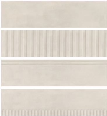
Naes Perla 15,6x60,6 506NAE06