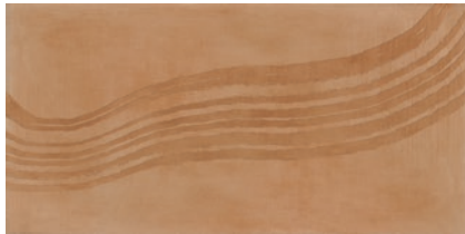
Nues Cotto 30x60 3060NUE70