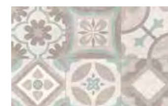
25x40 cm 0684082 MARMETTE CEMENTO ☞ ■ ■ CEMENTO FUMO