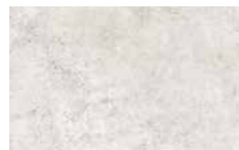
25x40 cm 0684076 CEMENTO