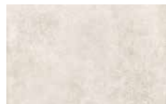
25x40 cm 0684077 SABBIA