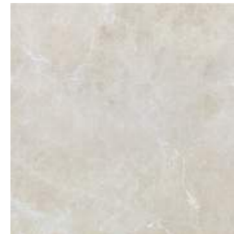
●At.Maia 45x45 M08 1.302.14093 PEI 4