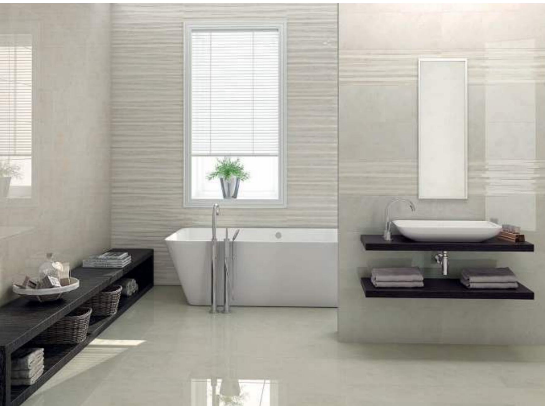
Rvto. / Wall / Rvtm.: At. Maia 25x70 - At. Maia Band 25x70 Pvto. / Floor / Sol: At. Maia 45x45