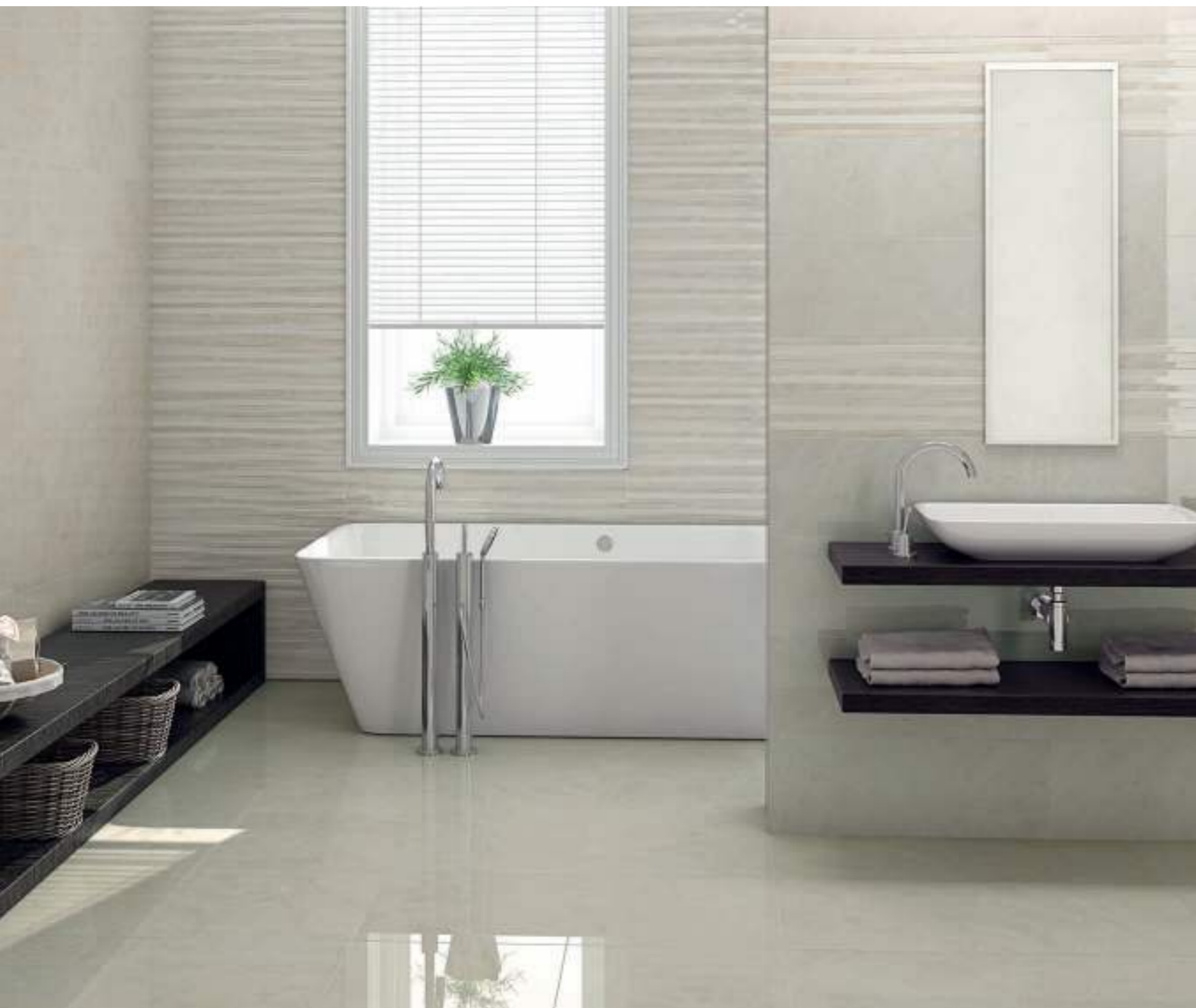
Rvto. / Wall / Rvtm.: At. Maia 25x70 - At. Maia Band 25x70 Pvto. / Floor / Sol: At. Maia 45x45