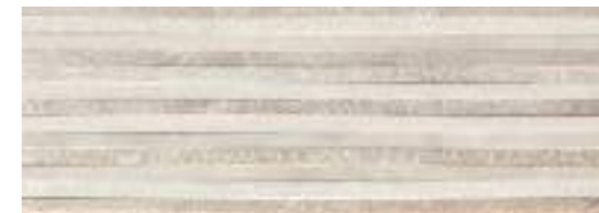
● AT. Maia Band 25x70 M08 2.185.15211

El modelo AT. MAIA BAND no tiene continuidad gráfica. The pattern in the AT. MAIA BAND model is not continuous. Le modèle AT. MAIA BAND n'a pas de continuité graphique.