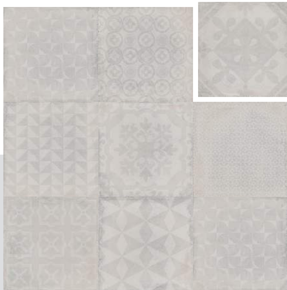
Tradición DEC. PERLA

variación gráfica / variation in pattern