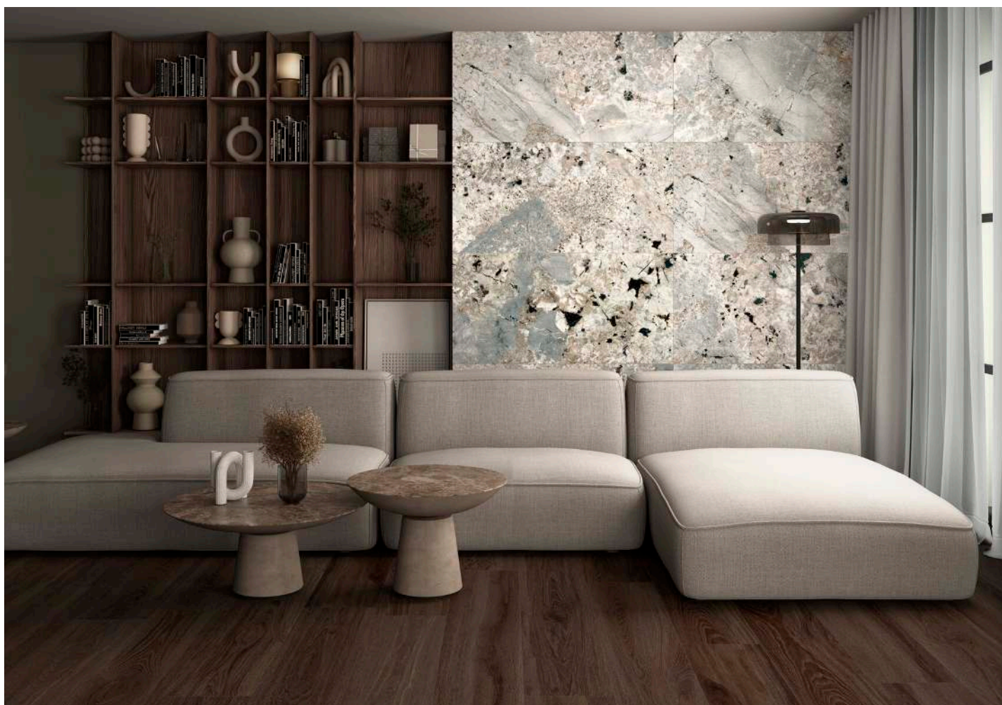
FLOOR TILE ALBAR WENGUE 25X150, AUSTRAL GRAY 120X120