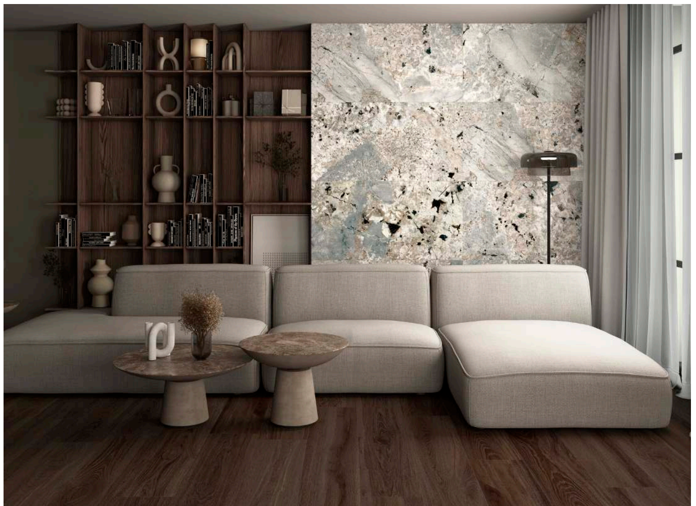
FLOOR TILE ALBAR WENGUE 25X150, AUSTRAL GRAY 120X120